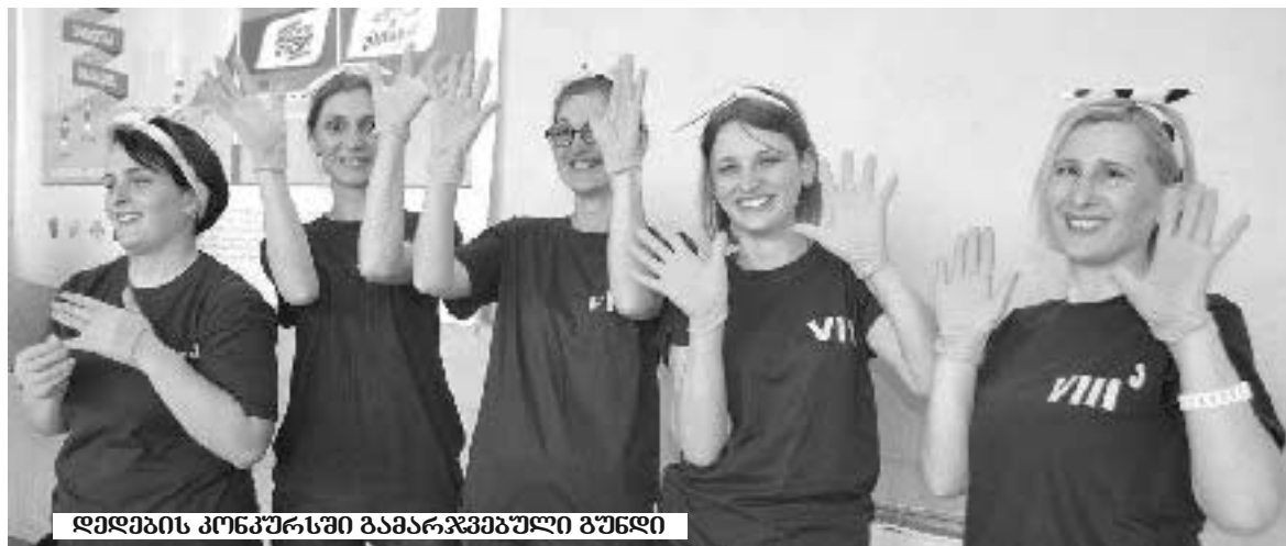
დედების კონკურსში გამარჯვებული გუნდი

შენ რომ დავალება არ გეწერა, რა გგონია, მაგის გამო არ დააკლდა მთელ კლასს ქულა? ბიჭო, გადაიწერე მაინც, ან მოგვწერე და დაგაწერინებთ. ვა, რა კილოგრამები, რისი მიტანა, რომელი ქულა? რა ადგილი? ჯერ რაღაც თავანი მეგონა, მერე კლასი და დავალება, რომ ასწინეს – უფრო დავიბენი. გადავწვიტე მეკითხე. ილა ჭაგაჭაგაძის სახელობის ქ. თბილისის 23-ე საჯარო სკოლის მერვეკლასელები აღმოჩნდნენ ბავშვები. კილოგრამებით – მაკულატურის შეგროვებას ითვლიდნენ, ქულებით კი – სკოლის დირექტორის მიერ დაწესებულ აქტივობებში გამარჯვებას. როგორც გავარკვიე, 23-ე საჯარო სკოლა საკუთარ პროექტ „რეიტინგს“ – ახორციელებს უკვე წელიწადია. ეს არის ნაკრები სახალისო აქტივობების, რომლებიც თავის მხრივ ხელს უწყობს რიგი უნარ-ჩვევების გამომუშავებას. როგორც დირექტორი მაგდა ბარამიძე ამბობს: ეს აქტივობები, გარდა უნარ-ჩვევების გამომუშავებისა, აუშვობს სწავლისა და დისციპლინის ხარისხს მოსწავლეებს შორის. მაგალითად, სპიკერების კონკურსი – აკადემიური აქტივობა – ამ კონკურსმა სპიკერის უნარ-ჩვევების მქონე ბავშვები წარმოაჩინა. თითო კლასს უნდა წარმოედგინა თითო სპიკერი: ბავშვები იწყებდნენ საუბარს ფრაზით: ჩემი აზრით – და შემდეგ ავრცობდნენ, რეკლამენტი ჰქონდათ 15 წუთი და მათ აფასებდნენ სკოლის მასწავლებლები, უფროსკლასელები