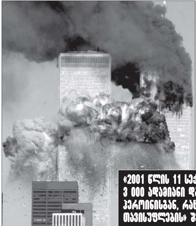
«2001 წლის 11 სექტემბრის ტერაქტის შედეგად დაახლოებით 3 000 ადამიანი დაიღუპა. ამასთან, ყოველწლიურად ავღანური ჰეროინისგან, რაც თავისთავად ოპიუმისა და ავღანური ნარკოტიკების წარმოების შედეგად თალიბების ხელი-

ვიქტორ ივანოვი: — მსოფლიო საზოგადოებამ, რომელიც 2001 წლის შემოდგომაზე ბონის კონფერენციაზე შეიკრიბა, გადაწყვიტა, რომ მართლაც საჭიროა სამხედრო ძალების გამოყენება იმისათვის, რომ განადგურებულიყო ალ-ქაიდას ბაზირების ადგილები ავღანეთში. ეს გადაწყვეტილება ყველამ მოინდონა, მათ შორის რუსეთის ფედერაციამაც.