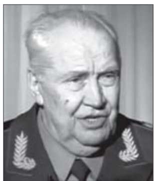
მაჰმუდ ბარაევი, სამხედრო მეცნიერებათა აკადემიის პრეზიდენტი, არმიის გენერალი:

ორგანიზაციის მონაცემებით, ყოველწლიურად მსოფლიოში ავღანური ჰეროინისგან დაახლოებით 100 000 ადამიანი იღუპება. მათგან ყოველი მესამე რუსეთის მოქალაქეა. დღესდღეობაში რუსეთში ავღანური ჰეროინით 82 ადამიანი კვდება.