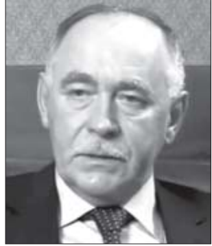
ვიქტორ ივანოვი, ნარკოტიკების ბრუნვის კონტროლის რუსეთის ფედერალური სამსახურის უფროსი:

— ავღანეთში ოპიუმის ყოველწლიური წარმოება საკმარისია 150 მილიარდი ერთჯერადი დოზისთვის. ეს 25-ჯერ მეტია, ვიდრე მთელი დედამიწის მოსახლეობა. ავღანური ჰეროინი მიდის ინდოეთში, ჩინეთში, კოსოვოდან კი — ევროპის ყველა ქვეყანაში. მაგრამ ავღანელი ნარკომოვაჭრების მთავარ მსხვერპლად რუსეთი იქცა. გაერთიანებული ერების