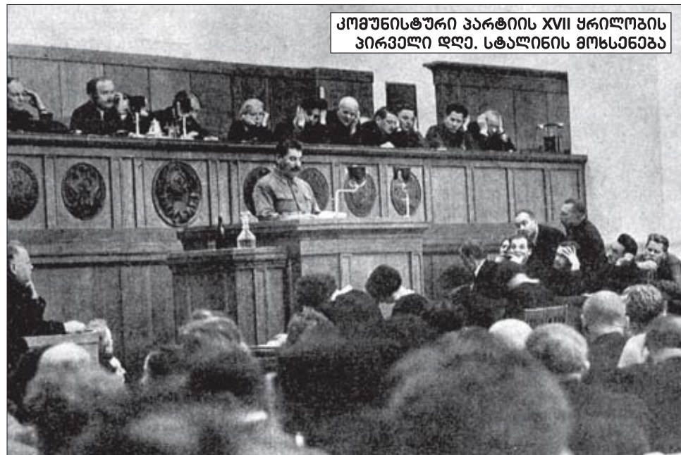
კომუნისტური პარტიის XVII ყრილობის პირველი დღე. სტალინის მოხსენება

კომისიის დასკვნაში, რომელსაც ხელს აწერს შატუნოვსკაია, არჩევნების ფალსიფიკაციაზე ლაპარაკი არ არის. მიუხედავად იმისა, რომ იმდროინდელ პარტიულ ხელმძღვანელოვას ხრუშჩოვის მეთაურობით უკვდავების წყალობით სჭირდებოდა მასალა „პროვინციის კულტის“ სამხელად.