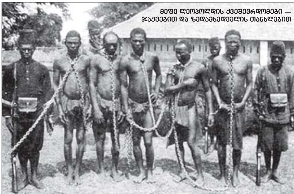
მეფე ლეოპოლდის ძველპროტოტიპი — ჯაჭვებით და ზადანსადავლის თანსაღობით

ბელგიის მეფე ლეოპოლდი, მატსახლად „გაქლარი სამეფო ტახტზე“ — იგი ადამიანის სოციალური კი აკეთილად ფულს!