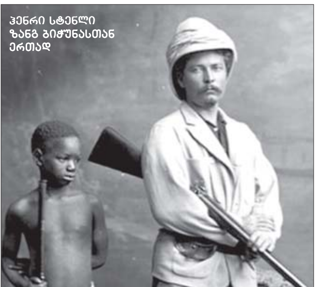
ჰენრი სტენლი ზანგ ბიჭუნასთან ერთად

ბელგიის ხსენებაზე ადამიანებს შეიძლება ბევრი რამ გაახსენდეთ ამ ქვეყნის შესახებ, მაგრამ თავში აზრადაც არ მოუვიათ, რომ ამ პატარა ქვეყანაში მასობრივად იბადებოდნენ მანიაკები, რომლებიც, კოლონიის სამეცნიერო-რაციონალური მეთოდებით ექსპლოატაციის მიზნით, შორეულ აფრიკაში მდებარე კონგოს კავშირების მფარველობდნენ.