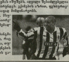
ტრავმა ავანტიურისკვლავი უკრაინელა