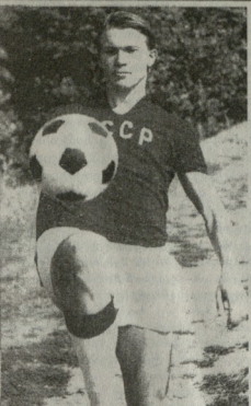
მოდებს ამანაგურ მატჩებში... ასევე ხდება მოთამაშეებიც კი ცდომილად თაბოებით შეესაძლებლობები სრულად გამოალოინან და მინუს, უფ ვეფიქრებთ ამანაგურ შედეგებზე იყოფილი მატჩებში.

♦ ამ ბოლო ერთი წლის განმავლობაში თქვე შედეგებზე? — თანხადაც. იცით, ნაკრებთან მუშაობა რადაცადაც ვანსკვლავებდა ვლენთან მუშაობაზე კლებთან ერთად ყოველდღე, რომ და იყო თითოეული მოთამაშის შესაძლებლობები, გან-