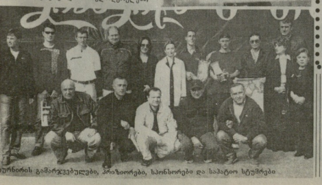
ბავშვების გამარჯვებულები, პრიზოები, სანახორები და სამატი სტუმრები