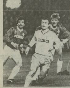
„ღლი“ N78-ში გამოქვეყნებული ფოტოსურათი.