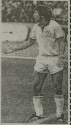
დი ანდრასისა და სინდალი გამოიყვანა...