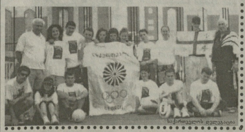
სპორტის განვითარების კომიტეტის წევრები