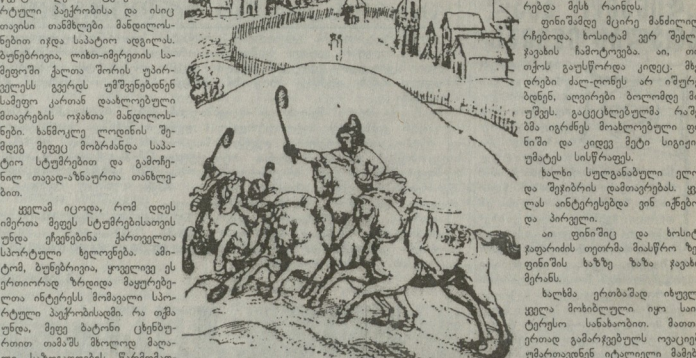
ჩემპიონი ცხენებითა მათი (კასტელის ხატი)

მათი წარმატება მათი უნარი და მათი სპორტული მზადყოფნაა. მათი წარმატება მათი უნარი და მათი სპორტული მზადყოფნაა.