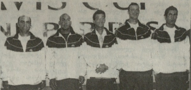
გვინტონიონი ნატივი. მარჯვნიდან პირველი კარგი ბაღი - კაპიტანი