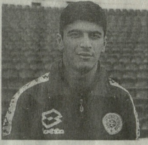
გვინა ბოლო გამოცემის. თავს არ ვიხივებ. იტალიური ბუნის არ მიწილი სკალი არ არის.

● ფისი ტიპის კონკრეტული გეგმა უნდა იქნას. ● ახალი გეგმა უნდა იქნას. ● უნდა იქნას „სპორტის“ ახალი გეგმისთვის უნდა იქნას. ● იტალიური ლიგის და სკალის რეფორმების პრობლემა არ არის. ● იტალიური ენა ენების, ამ ქვეყნის სამხარეთლო თუ მწიხრი კითხვებს კავშირს. ● იტალიური სამხარეთლო რაკალი კავშირებს დევნის.