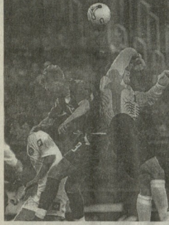
სის, „ლოპოტივში“ ვიგორების, ფეხბურთელბის ვიგორების უკვლავი ცალსაძრავი დასაძრავი თითო კიბე მგერის.

— თავსაბების მიმართ მოწინააღმდეგის კარის მოთმობით დარტყმით ბუნური კარის მულს ან ხარბის თუ მოხდება და გვაკარს უკან, ბუნური ჩიხივლის კონსტრუქცია გასაძრავი და თავდასაძრავი გუნდის უნდა ჩამორბების კონსტრუქცია. — გუნდების გამაქვებში მოყენილ ფეხბურთელს მიყვს საშუალება თამაშში მსვლელბის ნებისმიერი მწირობის მოსაზრებები. — უფრო მკაცრად დასაძრავი ფეხბურთელი, რომელიც ტრავმის მიმართედ, განსაკუთრებით სისის არეში მიტყვებს. — საკრბი დარტყმა კარის მიმართეული თავდასაძრავი სკალია რტყმები მოწინააღმდეგე მსვლელი მიმართედ.