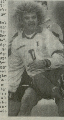
„ალლო“ N5-ში გამოქვეყნებული შეკითხვის პასხვი: მდინებრა გერმანული ფეხბურთელი მარო ბასტერი.

1. სურათზე კოლმებიდობა კარია, ფეხბურთელი, რომელიც წარუშლელი კვლად დაგვა თავისი ქვეყნის საფეხბურთო ისტორიაში, ვინაა იგი? 2. სურათზე განხილვა საუკუნის ერთ-ერთი უდიდესი იტალიელი ფეხბურთელი, ადვანსიზმელი, რომელიც ხედავს სასალი თამაშში. და მდინის „იტალიის მწიფილადია“. ● „მინისა“, „სუბინების“, „ივრეჯეშ“... იყო იტალიის ჩემპიონი და თბის მსვლელად, იტალიის ნაკრების წევრი. 1983 წელს აღიარებული იქნა იტალიის საფეხბურთო ისტორიაში მსვლელად დროის საუკეთესო ფეხბურთელი და მისი სახელი იტალიის მსვლელბის სადანიონის „სან-სკარიო...“ ვინაა იგი?