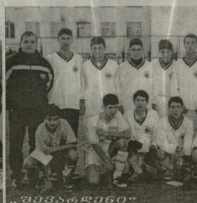
„სსრკ-ის უკვდავო ფეხბურთელები“

აქვეა, რომელიც წარმოადგენს სპორტის განვითარების ერთ-ერთი უძველესი კუთხეა.