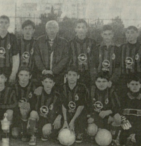
„სსრკ-ის უკვდავო ფეხბურთელები“

აქვეა, რომელიც წარმოადგენს სპორტის განვითარების ერთ-ერთი უძველესი კუთხეა.