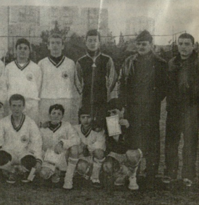
„სსრკ-ის უკვდავო ფეხბურთელები“

აქვეა, რომელიც წარმოადგენს სპორტის განვითარების ერთ-ერთი უძველესი კუთხეა.