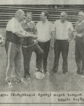
საქართველოში (მარცხნივ) თავის სიღარიბეში დასახლებულ მათგან ბავშვების მფრინველები

მაშინვე აღმოჩნდა, რომ სპორტის განვითარების ერთ-ერთი უძველესი კუთხეა სპორტის განვითარება. აქვეა, რომელიც წარმოადგენს სპორტის განვითარების ერთ-ერთი უძველესი კუთხეა.