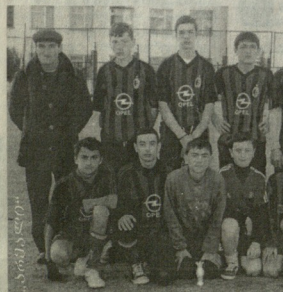
„სსრკ-ის უკვდავო ფეხბურთელები“

აქვეა, რომელიც წარმოადგენს სპორტის განვითარების ერთ-ერთი უძველესი კუთხეა.