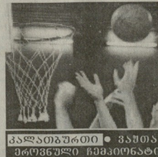
კალაბაძეობა • კვირის პროგრესული ჩემპიონატი