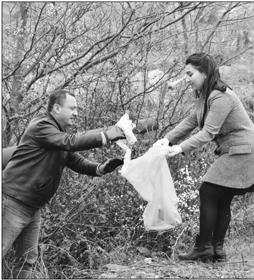
რისო დღეს მსოფლიო 1993 წლიდან ყოველ 22 მარტს აღნიშნავს. ამ დღესთან დაკავშირებით საქართველოს მუნიციპალიტეტებში დასუფთავების აქციები იმართება.

ოზურგეთის მუნიციპალიტეტის საკრებულო, წყლის საერთაშორისო დღესთან დაკავშირებით, საქართველოს მწვანეთა მოძრაობა/დედამიწის მეგობრების პროექტს „დავასუფთოთ საქართველო“ შეუერთდა და დასუფთავების აქცია გამართა. საკრებულოს ფაქცია „ქართული ოცნება-დემოკრატიული საქართველო“-ს ინიციატივით დასუფთავების აქცია სოფელ ლიხაურში გაიმართა. მასში მონაწილეობა კიდევ საკრებულოს სამი ფრაქციის: „ქართული ოცნება-მწვანეების“, „ქართული ოცნება - კონსერვატორების“, „ქართული ოცნება - მრეწველების“ წევრებმა და საკრებულოს აპარატის თანამშრომლებმა მიიღეს. ინიციატივას ლიხაურის საჯარო სკოლის მოსწავლეებიც შეუერთდნენ. ნარჩენებისგან დასუფთავდა სოფელ ლიხაურის ცენტრამდე მისასვლელი მთავარი გზა, სოფლის ცენტრი და მდინარე აჭის ხეობა. წყლის რესურსების დაცვის საერთაშორისო