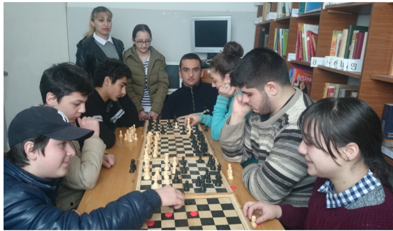
ბაღში, ზოოპარკში, დედაენის ძეგლთან და ა. შ. სკოლის შინაგანანგის მიხედვით და მოსწავლეთა დისციპლინის კუთხით, შესანიშნავად მუშაობს სკოლის