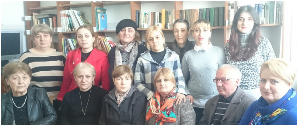
საქმიანი ურთიერთთანამშრომლობა და ბავშვებისთვის უსაფრთხო გარემოს შექმნა... სკოლას მსახურება კვალიფიციური ექსპერტიზის და ფსიქოლოგიური დახმარებით... საბუნებისმეტყველო, ექსპერიმენტული საგნების (ფიზიკა, ქიმია, ბიოლოგია) სწავლებაში, მალალი აკადემიური მოსწრების მისაღწევად, ეფექტურად გამოიყენება სასწავლო ლაბორატორიები, რო-