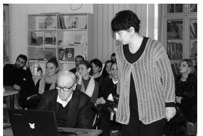
დაგოგი ჩაერთო, სასერტიფიკატო გამოცდები 550-ზე მეტმა ჩააბარა. სამინისტროში სწორედ მათ გადასცეს სერტიფიკატები, თუმცა – მხოლოდ თბილისისა და მცხეთა-მთიანეთის წარმომადგენლებს, შიდა ქართლს კი, მოგვიანებით გადასცემენ.