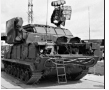
საზენიტო სარაკეტო კომპლექსი Top M-1.

ციმბირის სამხედრო ოლქის საარტილერიო დანადგარი „შილკა“ სწავლებების დროს ალაპინოს პოლიგონზე, სადაც მუშავდებოდა საბრძოლო ამოცანები მონიანალმდევის მიერ მალალი სიზუსტის იარაღის და ავიაციის გამოყენების პირობებში.