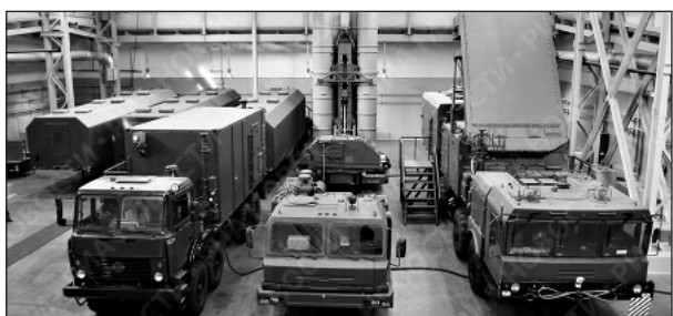
საზენიტო სარაკეტო სისტემა C-400 „ფავორიტი“, რომელიც ახლა ავსებს რუსეთის არმიის შეიარაღებას.