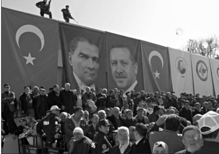
население будет иметь возможность установить в указанных местностях земельный закон, соответствующий его пожеланиям;

საქართველო ომის ქარცეცხლში იყო გახვეული, გორსა და მიმდებარე სოფლებში ცოდვის კალო ილენებოდა, თბილისში „ლამის მთველებს“ ვმასპინძლობდით და რუსთაველზე „კუდიანების დავლური“ გაემართათ „დაბომბვის პირდაპირი შეტაკების მიუხედავად“. შარშანდელი აგვისტო კიდევ არაერთხელ შეგვახსენებს თავს. ყურს იქით გავატარეთ ინფორმაცია, რომ ასეთ ვითარებაში ნატოს წევრი ქვეყნებიდან ერთადერთმა მხოლოდ თურქეთმა არ დაგმო რუსეთის მიერ არაპროპორციული ძალის გამოყენება, ანუ აგრესია საქართველოს წინააღმდეგ. არც იმისთვის მიგვიქცევია ყურადღება, რომ იმ დღეებში თურქეთის პრემიერ-მინისტრი ერდოღანი მოსკოვში საგანგებოდ ჩავიდა რუსეთის ხელისუფლების პირველ პირებთან სასაუბროდ. იმავითვე ცხადი იყო, რომ ასეთ სასწრაფო რეჟიმში, როცა ფოთის პორტი იბომბებოდა, ერდოღანს მხოლოდ თავისი ქვეყნის ინტერესები აიძულებდა მედვედევსა და პუტინთან პირისპირ შეხვედრას.