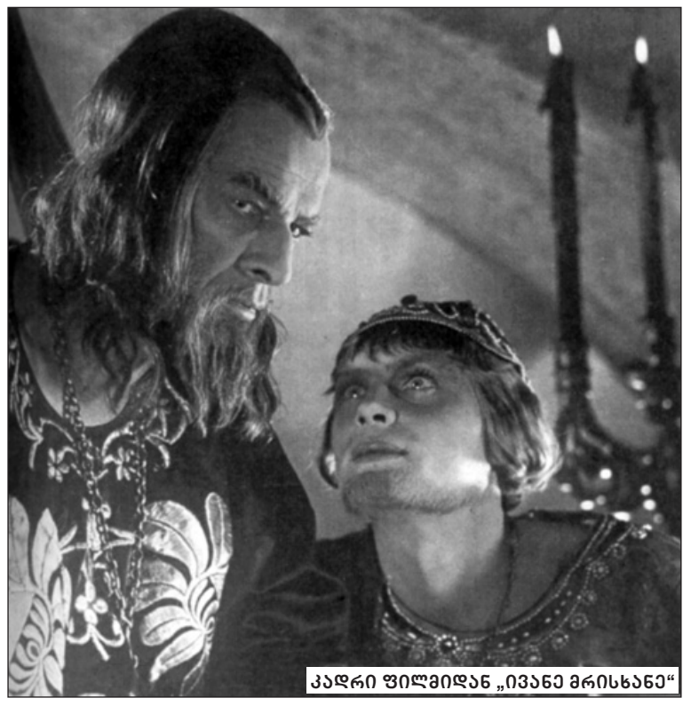
კადრი ფილმიდან „ივანე მრისხანე“

სტალინი (იხსენებს ცალკეულ შემსრულებელს „ივანე მრისხანეს“ პირველი სერიიდან). კურბსკი ჩინებულია. ძალიან კარგია