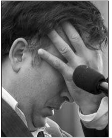
ძალას კარგავენო. თურქეთს საქართველოსთვის აჭარა არ დაუთმიაო... აჭარაზე კონტროლის დაკარგვასთან ერთად საქართველო კარგავს მეორე (აფხაზეთის შემდეგ) რეგიონსაც, რომლის გარეშე გეოსტრატეგიული მდგომარეობის მნიშვნელობაზე ლაპარაკიც კი ზედმეტია“.

აფხაზეთი ზუსტად ის ერთ-ერთი უმნიშვნელოვანესი რეგიონია, რომელიც საქართველოს გეოპოლიტიკურ მნიშვნელობას განაპირობებს. აფხაზეთის გარეშე ეს მნიშვნელობა განახევრებულია. მეორე ასეთივე მნიშვნელობის რეგიონი არის აჭარა... აი, თურქეთში უკვე გამოიცემა წიგნები, იბეჭდება სტატიები, რომლებშიც გვიმტკიცებენ, რომ „აჭარელი ხალხი“ თურქულ ეთნოსს მიეკუთვნება, ისმის მონოდებები, შეწყდეს „აჭარელთა ასწლიანი ძალდატანებითი გაქართველება“, პარალელურად გამოიქვლია XIX საუკუნის რუსეთ-თურქეთის ხელშეკრულების გადახედვის ძლიერი კამპანია. ლაპარაკია იმ ხელშეკრულებებზე, რომელთა მიხედვით, თურქეთმა დაუთმო რუსეთს ტერიტორია, მათ შორის, ჯავახეთიც და აჭარაც. არგუმენტი მოჰყავთ სერიოზული: თურქეთმა დაუთმო ეს ტერიტორია რუსეთის იმპერიას, რომლის უფლებათა მემკვიდრე იყო საბჭოთა კავშირი. დღეს არ არსებობს არც რუსეთის იმპერია, არც სსრკ, საქართველო კი დამოუკიდებელი ქვეყანაა. ამით უკიდრებელი ქვეყანაა. ამიტომ ის ხელშეკრულებები