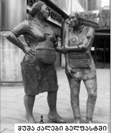
მუშა ქალები ბელფასტში