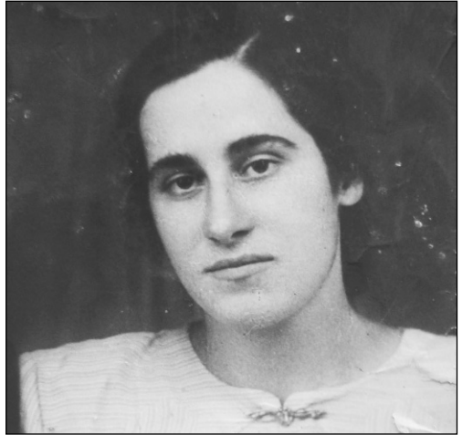
მაგრამ ათასი ბავშვის მშობელი“.

როცა თვალს შევაკლებთ შენ მიერ ამაყად განვილილ გზას, თამამად შეიძლება შენი პიროვნება შეედაროს ჯარისკაცის ქვერვს, ოთარანთ ქვერვს, ყველა დედას, ვინც ცხოვრების უკუღმართობამ, ბედისწერამ ცალად დატოვა; ვინც სინდისით, ნამუსით ზიდა ცხოვრების მძიმე ტვირთი; ვინც არ შებღალა ქართველი ქალის სახელი, მანდილი, ღირსება; ვინც არ შეუმინდა ასეთი ქალის ცხოვრების გზაზე ჩასაფრებულ მოსალოდნელობას, საფრთხეს და ამაღლებული დარჩა ქვეყნისა და საზოგადოების თვალში.