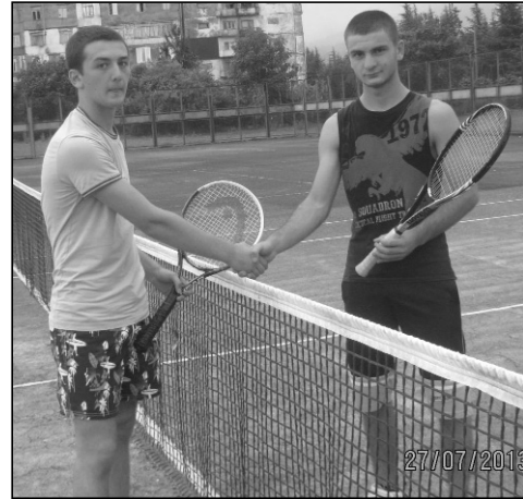
როგორც ვწერდით, მალე კიდევ ერთი ტურნირი გაიმართება ჩოგბურთში,

ამჯერად „მოღერნის თასზე“ რომელშიც მონაწილეობის სურვილი უკვე გამოთქვა რამდენიმე ჩოგბურთელმა. სავარაუდოდ, ამ ტურნირში 20-მდე ჩოგბურთელი მიიღებს მონაწილეობას.