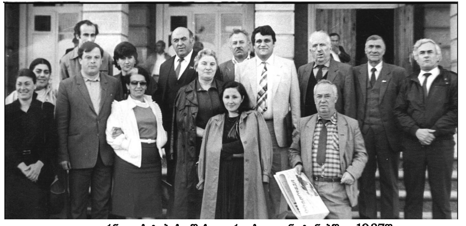
ჟურნალისტების შეხვედრა სოფ. ნატანებში. 1987წ.