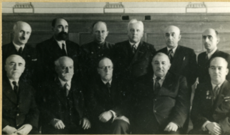
Քրեզիդուտի Աւււնյա Մւււ Տւււտո՞ւ Չրւււլի, Արմւււնի, Աւււրաւււյձյա՞նա.