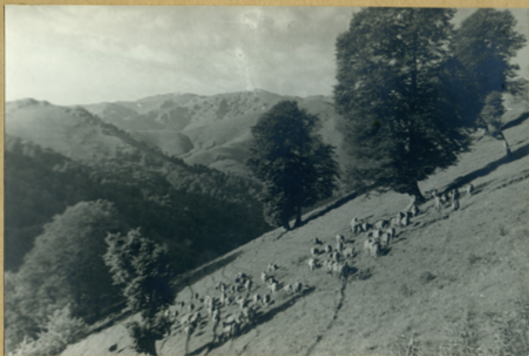
Ծորնի քայքայումը Երևանում