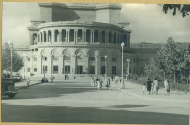
Театр оперы и балета