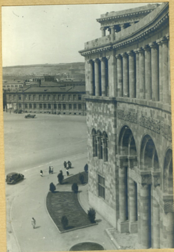
Դոմ քրավիտելեճտա Արմ.ՍՍՐ.