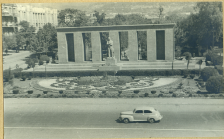
Площадь и памятник В.Блохину