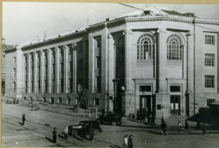
Главный корпус медицинского института