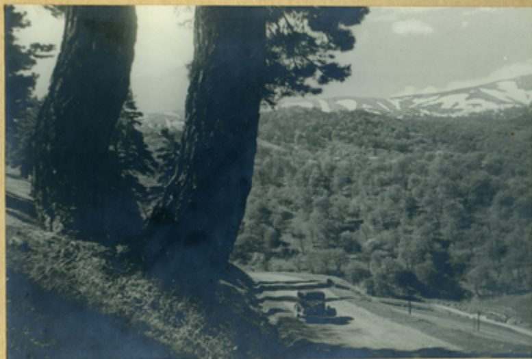
Դорога от Делижана к оз. Севан