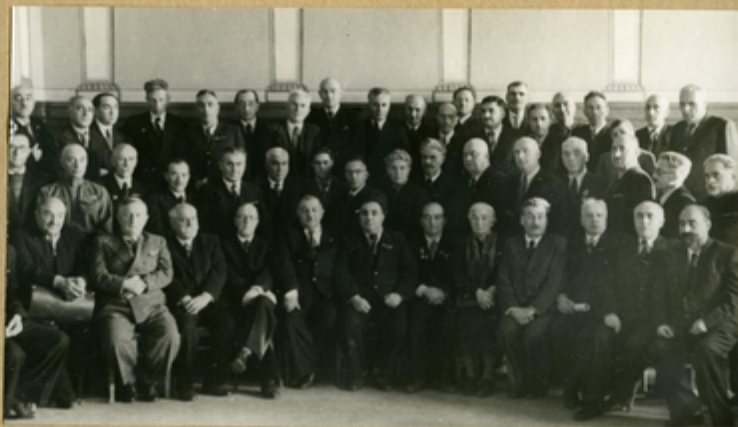
Участники-делегаты II совещания Ученых Мед. Советов Министерств Здравоохранения Закавказских Республик