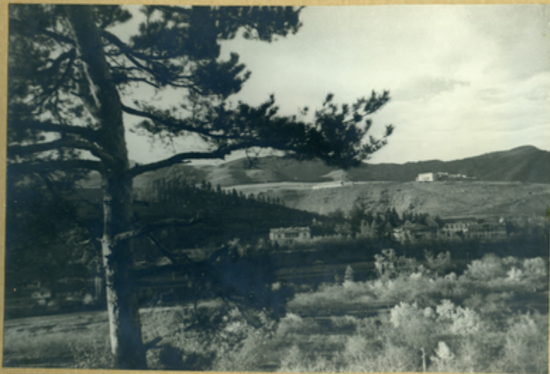
Օճիկի տեսարանը Դելիջանի կուրորտի սանատորիայի