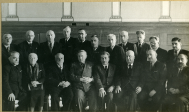
Делегация Ученого Мед. Совета Грузии