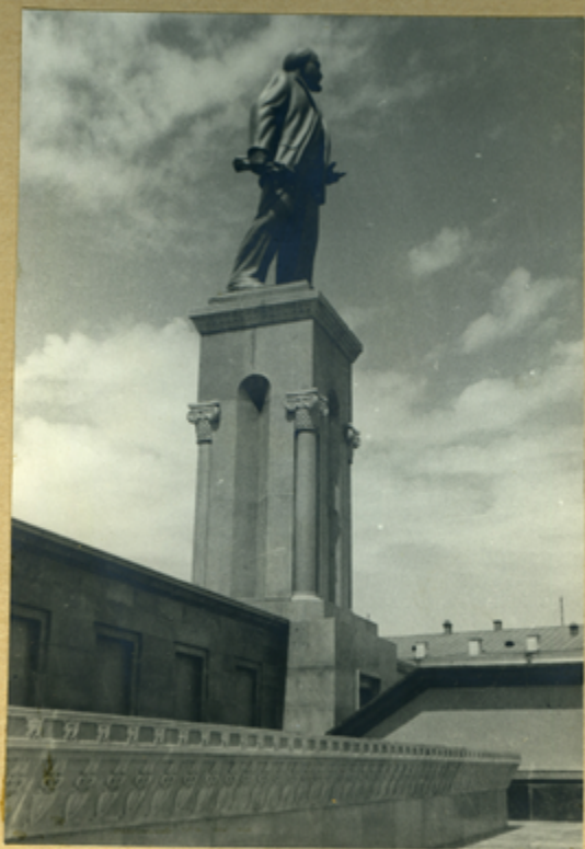
Памятник В.И. Ленину