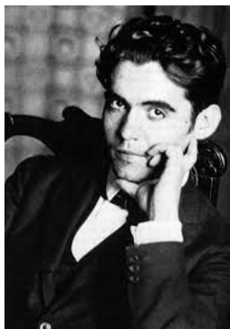
ფედერიკო ბარსია ლორკა