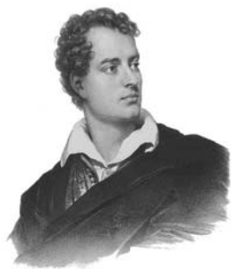
გიორგი მერჯანიშვილი ბაირონი