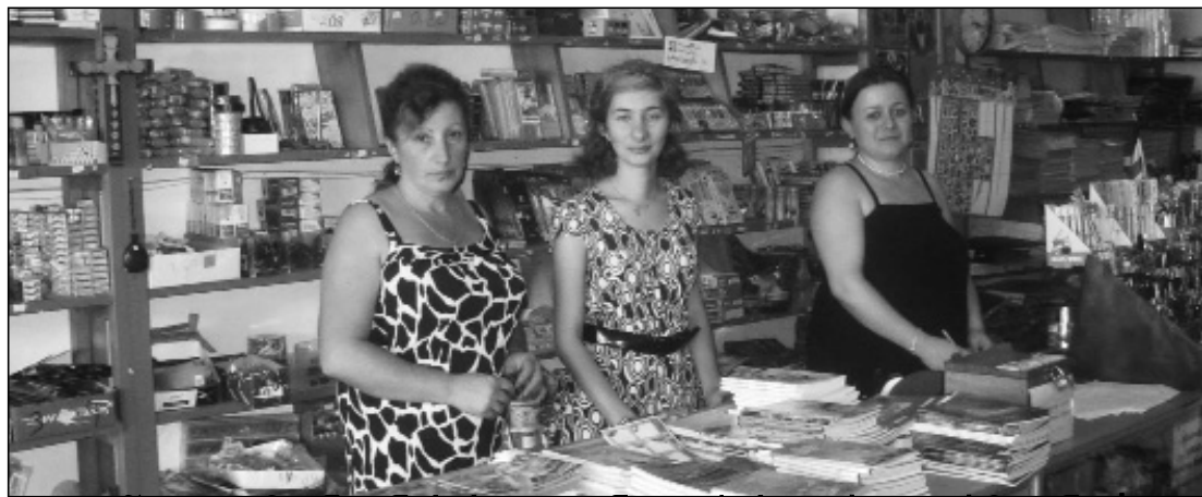
გვენვეით, ჩვენთან სასკოლო ნივთების ფართო აჩვენებია! მისამართი: ქ. ოზურგეთი, ავ. ნედაძის ქ. № 10

მაღაზია „თა-კა-სი“ ვილოცავთ ახალი სასწავლო წლის დაწყებას!