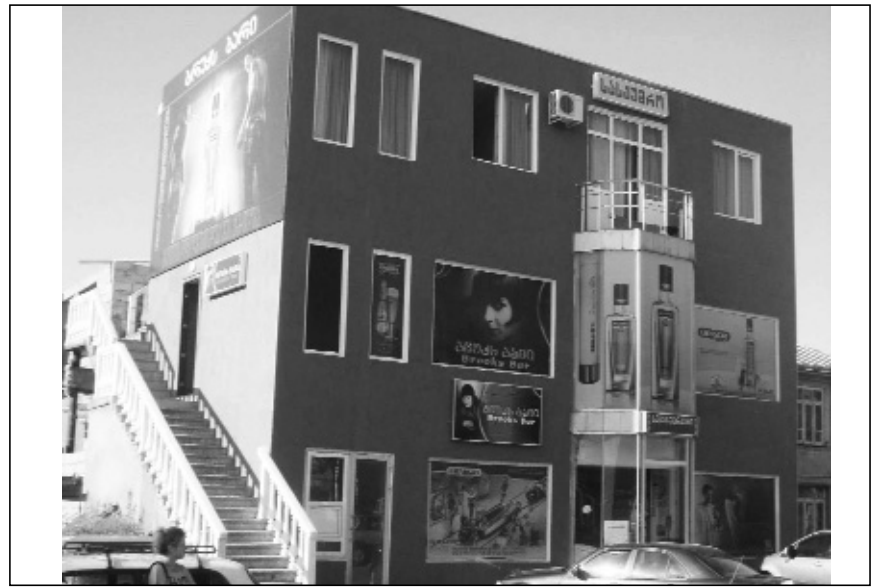
გვენვეით, ჩვენთან მომსახურების ფართო აჩვენებია! მისამართი: ქ. ოზურგეთი, გუჩიის ქ. № 17

ინდიქსზე „ვასილ ბეშიტაიშვილი“ ვილოცავთ ახალი სასწავლო წლის დაწყებას!