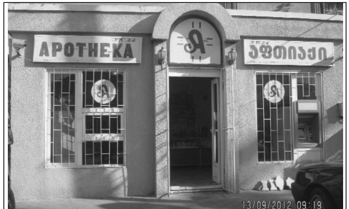
მისამართი: ქ. ოზურგეთი, გუჩიის ქ. № 12

აფთიაქი „PM“ ვილოცავთ ახალი სასწავლო წლის დაწყებას!