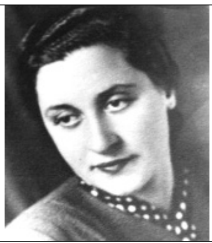
ასეთად დარჩები მუდამ ჩვენს მეხსიერებაში.

შენს არისტოკრატიზმსა და სილამაზეს სიბერემ მინც დააჩნია კვალი, მაგრამ მან ვერაფერი დააკლო შენს ბუნებას, სიმშვილეს, კეთილზნობას.