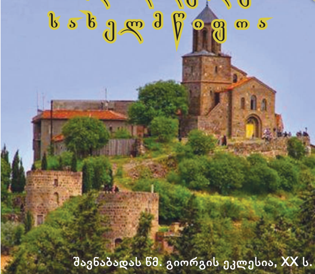
შავნაბადას წმ. გიორგის ეკლესია, XX ს.

ს ა შ ა ნ თ ე კ ლ თ მ ა ნ თ ლ მ ა დ ი დ ე ბ ლ უ ნ ი ს ა ხ ე ლ მ წ ი ფ თ ა