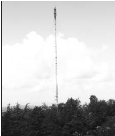
ტ. „ბურია“-ს ანდა სოფ. ჯუმათში

ციფრული მაუწყებლობა იმის საშუალებას იძლევა, ერთ არხზე ოთხი არხი ჩართოს. რეგიონული ტელევიზიების ასოციაცია ვაპირებთ, ერთიანი რაღაც სისტემას შევქმნათ. ერთმანეთს დავეხმაროთ, ერთმანეთის სიგნალი გავაგრძელოთ. ასე, კოოპ-