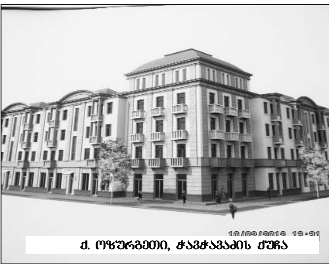
მ. ოზურგეთი, ჭავჭავაძის ქუჩა

ამის გარდა გაგრძელდება ქუჩების ასფალტირების, გაზიფიკაციის, წყლის სისტემების, განათების, მრავალბინიანი სახლების გადართვის და სხვა სამუშაოები. ამ თემებს ეტაპობრივად გაგაცნობთ.— თქვა მან.