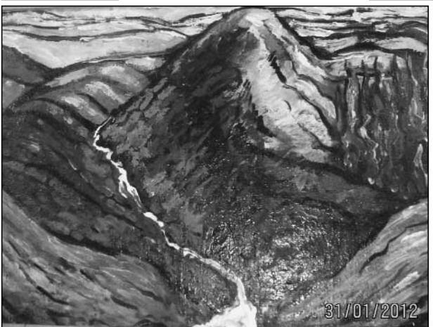
„ბუთის მთები“ (ტილო, ზამთი).

ფლობს იგი. საუკეთესო მეგობარია, საუკეთესო ოჯახი აქვს, ამასთან ერთად კარგი ორგანიზატორი და კარგი ხელმძღვანელია. ის არის გურიის მხატვართა კავშირის გამგეობის წევრი და თავის მოვალეობას კეთილსინდისიერად ასრულებს. გურიის მხატვართა განყოფილების გამგეობა, მთელი შემოქმედებითი ჯგუფი გულითადად ულოცავს მის პერსონალურ გამოფენას და უსურვებს დიდ შემოქმედებით წარმატებებს მომავალ სარბიელზე.