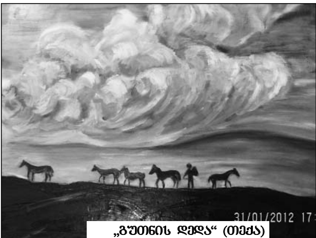
„ბუთის დედა“ (თექა)