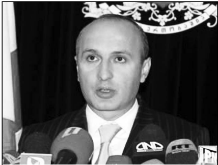
ლანჩხუთში შინაგან საქმეთა მინისტრმა ვანო მერაბიშვილმა ბავშვებთან ერთად, გამჭვირვალე და თანამედროვე ტექნიკით აღჭურვილი შენობა გახსნა.