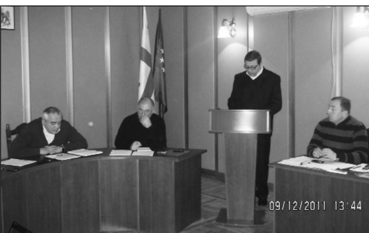
55 წუთიანი ლოდინის შემდეგ, პარასკევს საკრებულოს სხდომა დაიწყო. სხდომის დაგვიანების მიზეზი უშუქობა იყო. ზუსტად ეს დრო დასჭირდა აენერგო პრო გლორვიას ოზურგეთის მომსახურების ცენტრს პრობლემის მოსაგვარებლად. სხდომას დეპუტატთა უმრავლესობა დაესწრო. ოპოზიციიდან სრულად ესწრებოდნენ ფრაქცია „ქრისტიან-დემოკრატები“. არ ესწრე-