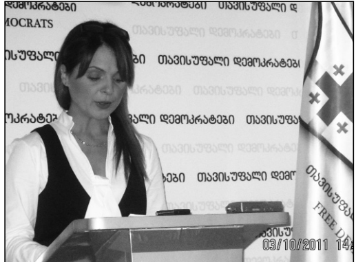
პოტერების საჩუქრად გადაცემის ფაქტზე, რაც მისი თქმით ძალიან კარგია, მაგრამ ქსელის გაუმართაობის გამო ბევრ სკოლაში პრობლემა შექნილია.