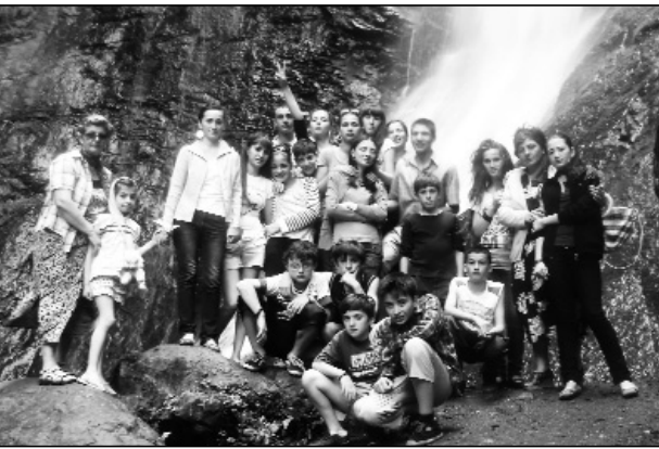
ადამიანი ცნობილია თავისი ცნობისმოყვარეობით, სკოლა მით უფრო.

შეიძლება მასწავლებელმა თავისთვის იქნებ ადამიანი რაიმე კიდევ, მაგრამ, მოსთვისაც ის სკოლაში დადის, იმათთვის ეს სამყარო მეცნიერულად, ტექნოლოგიურად, ფსიქოლოგიურად ხომ აღმოსაჩენია (რა თქმა უნდა ბავშვის „ჰორიკნობის“ უნარსაც ხომ გააჩნია).