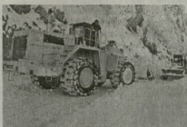
Средства, принадлежащие частным предпринимателям.

По данным армянской стороны, с конца ноября на КПП скопилось около 200 транспортных грузовиков, среди которых грузские автомобили, среди которых грузские автомобили пяти-шести компаний-перевозчиков, а также транспортные