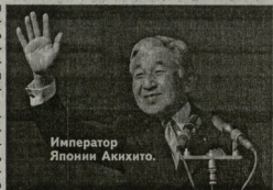
Император Японии Акино.

Согласно нынешнему закону, японский император правит пожизненно. Акино зашел на престол 22 года назад, в декабре ему исполнится 78 лет. В 2008 г. Управление императорского двора несколько обновило график его работы, сократив список официальных мероприятий. Это было связано с тем, что у императора