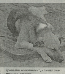
«домными животными», - пишет знаменитая актриса.

Известная французская актриса и защитница прав животных Бриджит Бардо обратилась с письмом к мэру Тбилиси Гиуи Угуава. Как сообщили журналистам представители Общества защиты и спасения животных Грузии, в письме выражена озабоченность в связи с существующим в столице Грузии методами борьбы с бездомными животными.