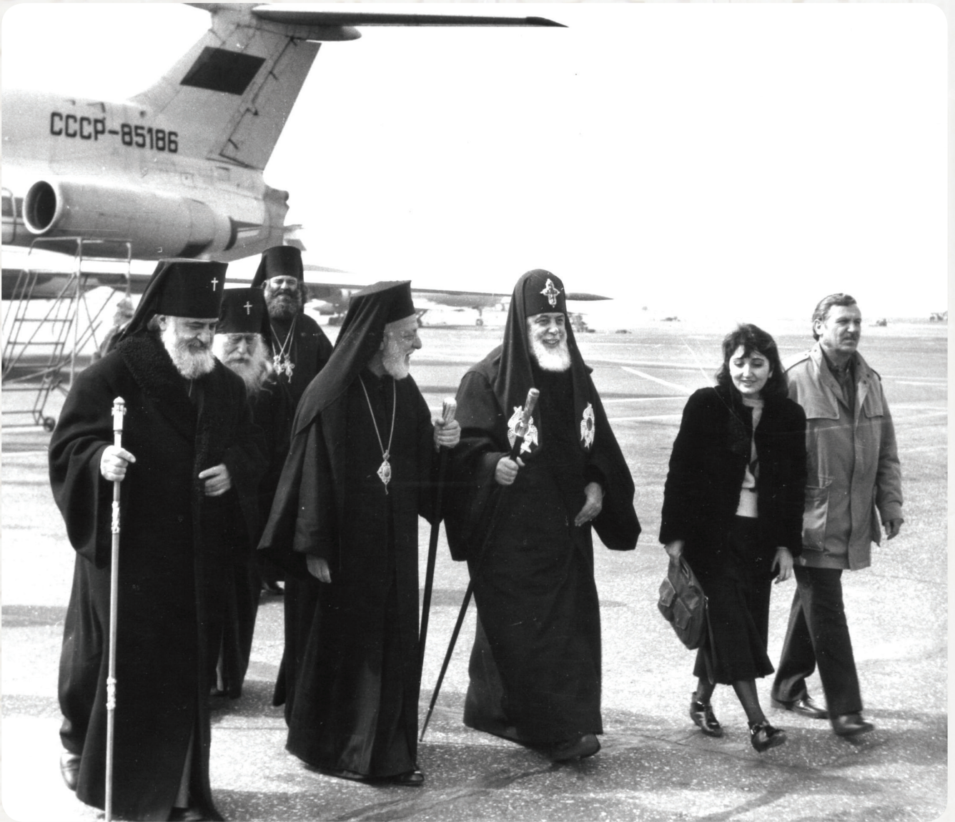
კათოლიკოს-პატრიარქი ილია II, ალექსანდრიისა და სრულიად აფრიკის პატრიარქი პართენიოსი, მიტროპოლიტი დავითი (ჭკადუა), მიტროპოლიტი გრიგოლი (ცერცვაძე), ეპისკოპოსი კალისტრატე (მარგალიტაშვილი), ქნი თამარ მესხი. 1987 წელი

საქართველოს ეკლესიის მეთაურის მცდელობამ შედეგი გამოიღო: 1990 წლის 4 მარტს, მართლმადიდებლობის ზეიმზე, კონსტანტინეპოლში (სტამბულში) სრულიად საქართველოს კათოლიკოს-პატრიარქ ილია II-ს შესატყვისი დოკუმენტები გადაეცა. იქაც მე ვთარჯიმნობდი. შეუძლებელია იმ სიხა-