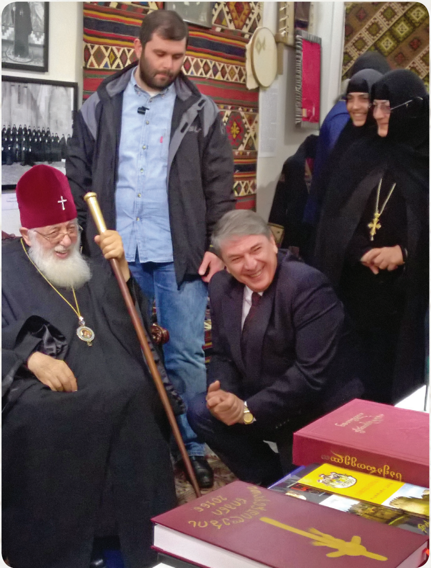
პატრიარქი სამთავროს მუზეუმში

საფრთხის გამო, მისი შემფოთებული სახე და მის ხმაში აღბეჭდილი უდიდესი მწუხარება.