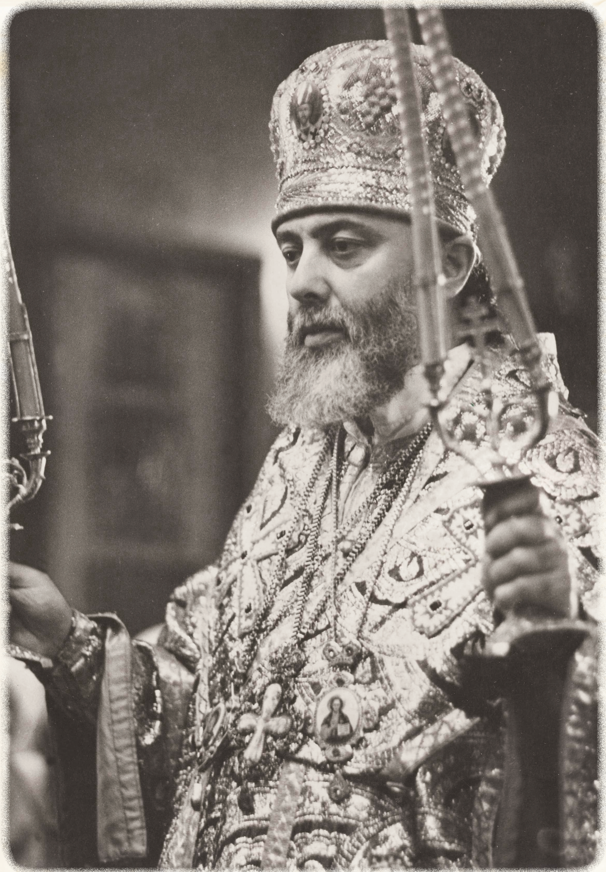
პირველი წირვა საქართველოს კათოლიკოს-პატრიარქის ხარისხში; 1977 წელი, 25 დეკემბერი. სვეტიცხოველი