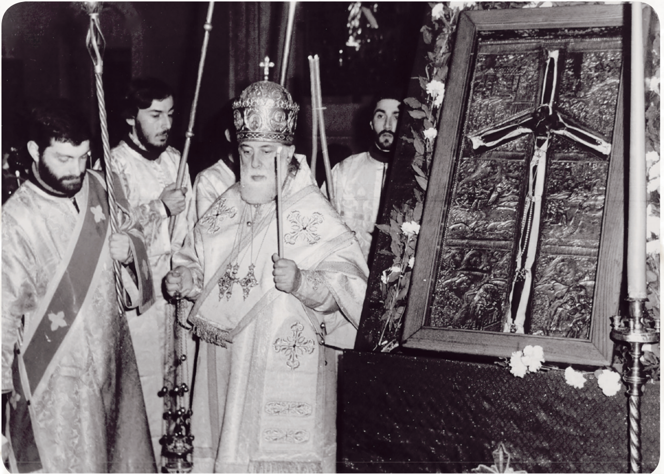
უწმიდესი და მამა რევაზი დიაკვნის ხარისხში

მოწყალე უფალმა წილად მარგუნა ეკლესიურ ოჯახში დაბადება. პატარაობიდანვე ეკლესიის სულიერ ცხოვრებაში ვლებულობდი მონაწილეობას. მე კარგად მახსოვს უწმიდესი ეფრემ II-ისა და უწმიდესი დავით V-ის წირვა-ლოცვები სიონში. დღესასწაულსაც მცირე მრევლი ესწრებოდა, მაგრამ 1977 წლის 25 დეკემბერს მცხეთაში, სვეტიცხოვლის საკათედრო ტაძარში, მრავალათასიანი კრებულის წინაშე მოხდა მისი უწმიდესობის, ილია II-ის ინტრონიზაცია და დაიწყო ეკლესიის ისტორიაში ახალი ერა.