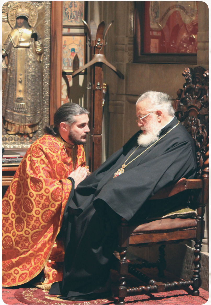
უწმიდესი და დეკანოზი შალვა

როგორი ბედნიერები ვიქნებოდით, თქვენ 20 წლით ახალგაზრდა რომ იყოთ, რამხელა სიხარული იქნებოდა თითოეული ჩვენგანისათვის-მეთქი. პატრიარქმა შემომხედა და მიპასუხა, ოცი წლით გამოუცდელი ვიქნებოდით.