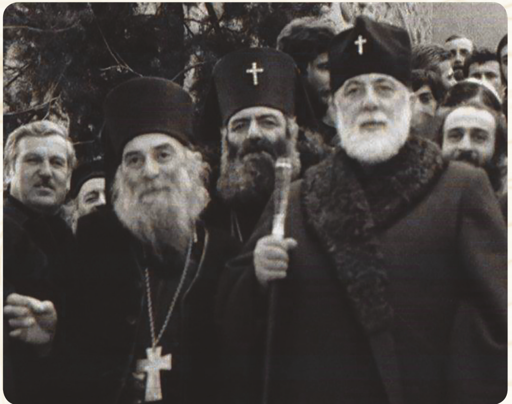
ღირსი მამა გაბრიელი და პატრიარქი ილია II

წმიდა მიწაზე საქართველოს კათოლიკოს-პატრიარქის, უწმიდესისა და უნეტარესის, ილია II-ის პირველი სტუმრობისას უწმიდესმა 5000-ზე მეტი ადამიანის სია დამაბეჭდინა, წმიდა ადგილების მოლოცვისას აღვლენილ წირვებსა თუ პარაკლისებზე მოსახსენიებლად. მამა ღვთისომ (შალიკაშვილი) ჩამოსვლისთანავე მითხრა: რა დაბეჭდე ამდენი, სამი საათი არ ჰყოფნიდა უწმიდესს წასაკითხადო. მთელი საქართველოს მოსახლეობის სახელობითი სიაც რომ ჰქონოდა, მასაც სიხარულით წაიკითხავდა ჩვენი პატრიარქი, თითოეული ქართველის მამა და თავდადებული მლოცველი. როცა ჩამობრძანდა, პატრიარქმა ყველანი დაგვასაჩუქრა იერუსალიმიდან ჩამოტანილი სიწმიდეებით. დღემდე სათუთად ვინახავ უწმიდესის ნაბო-