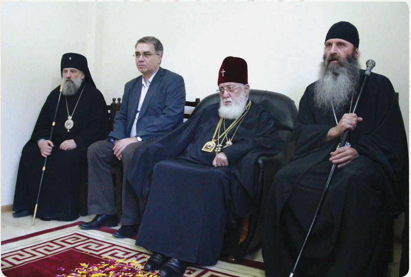
უწმიდესი და უნეტარესი ილია II, მარცხნივ – მიტროპოლიტი ილარიონი, მარჯვნივ – ბატონი დავით სერგაქენკო და მიტროპოლიტი იოანე

მესტიისა და ზემო სვანეთის მიტროპოლიტი ილარიონი (ქიტიაშვილი)