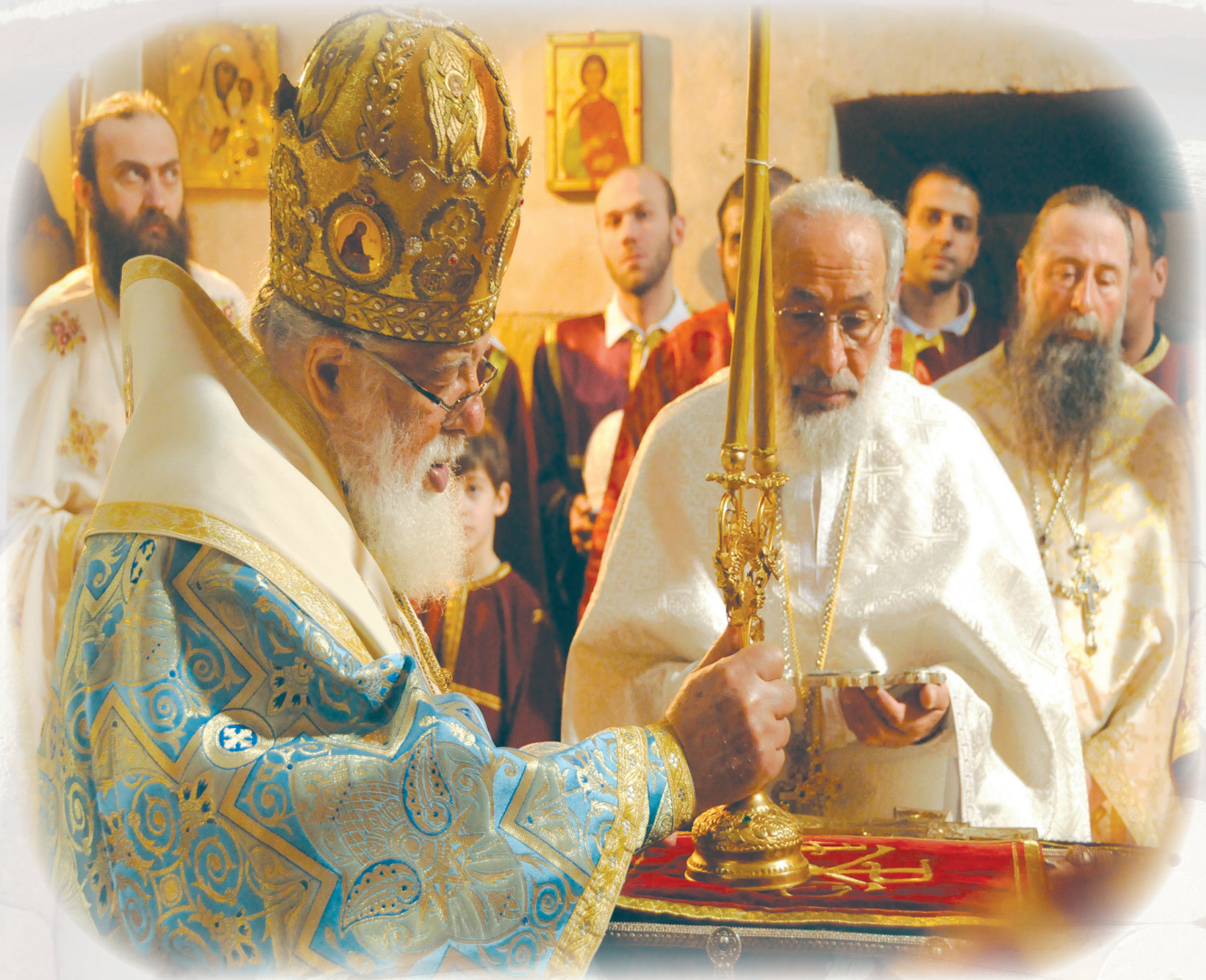
კათოლიკოს-პატრიარქი ილია II და არქიმანდრიტი ლაზარე (გაგნიძე)

ქართველ ერში დაფარული დიდი სულიერი პოტენციალი მთელი სისრულით გაბრწყინდა ამ წლებში. მოკლე ხნის განმავლობაში ერთიმეორის მიყოლებით, თითქმის ერთდროულად გამოიცა ივანე ჯავახიშვილის „საქართველოს ისტორია“ ოთხ ტომად და „ქართლის ცხოვრების“ ოთხტომეული სიმონ ყაუხჩიშვილის რედაქციით. ამ გამოცემით ქართველ მკითხველს შესაძლებლობა მიეცა, მანამდე ხელნაწერების სახით არსებული ქართველი მემკვიდრეების: ლეონტი მროველის, ჯუანშერის, ჟამთააღმწერლის თხზულებებს ზიარებოდა არა წიგნსაცავებში, არამედ საკუთარ თბილ ოჯახურ გარემოში.