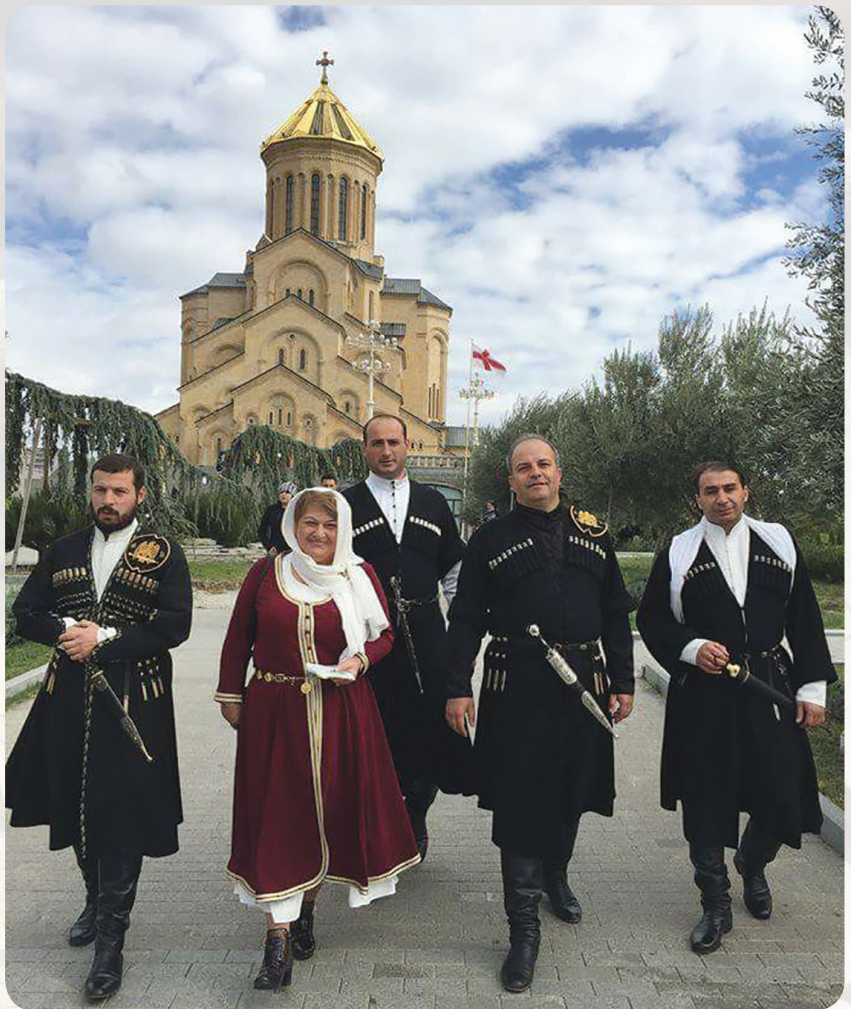
ჩოხოსნები. მარჯვნიდან მეორე ზვიად სეხნიაშვილი

ათასობით ადამიანის ხმაც იყო: თქვენო უწმიდესობავ, თქვენ დიდხანს, ძალიან დიდხანს უნდა იცოცხლოთ, რადგან ქართველი ერის იმედი ხართ და ყველა თქვენ შემოგყურებთ-მეთქი. გამიღიმა თავისი სათნო ღიმილით, მომეფერა, გულზე ხელი დაიდო და მითხრა: სანამ გამიძლებს, ჩვენი სამშობლოსა და თქვენთვის ვილოცებო!..