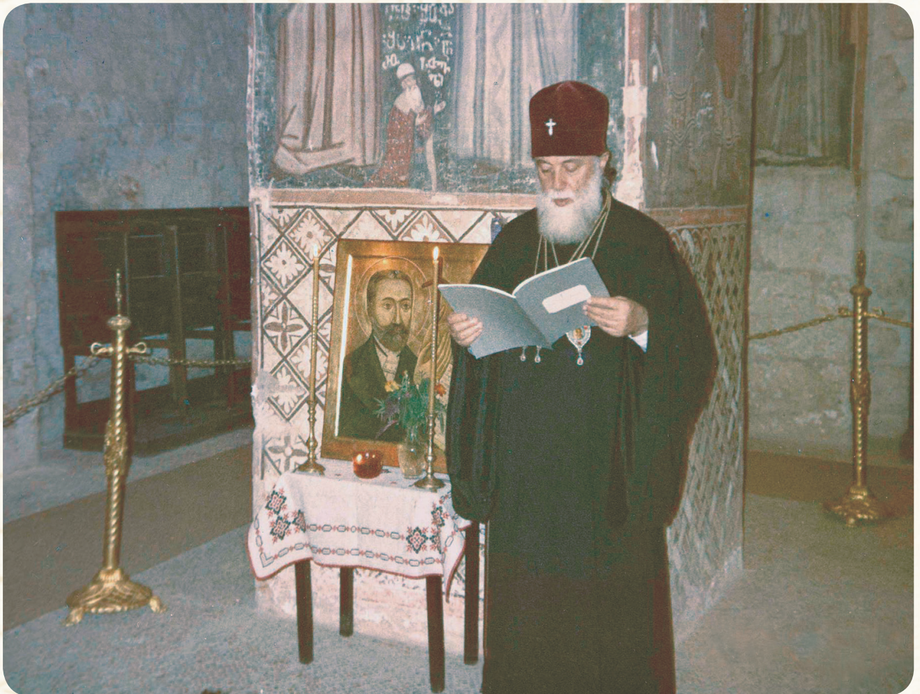
იერუსალიმი. ჯვრის მონასტერი. 1987 წელი. პატრიარქი კითხულობს მოსახსენებელს