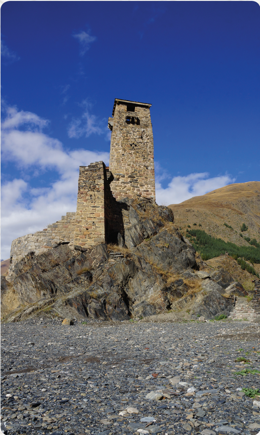
სნო. ღუღუშაურების საგვარეულო კოშკი