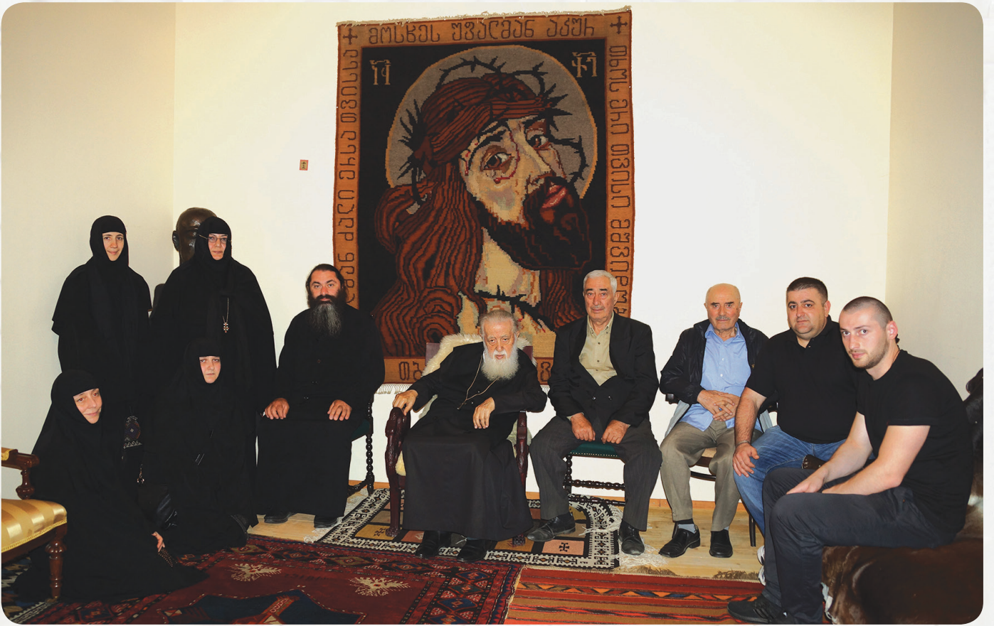
სწ. პატრიარქის სახლში