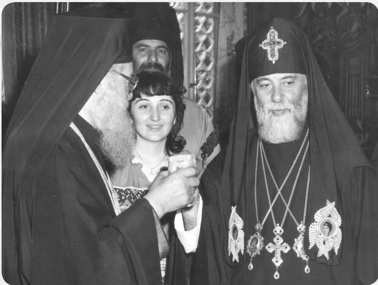
კათოლიკოს-პატრიარქი ილია II, ალექსანდრიისა და სრულიად აფრიკის პატრიარქი ნიკოლოზი და ქნი თამარ მესხი. 1981 წელი

რულის სიტყვებით გადმოცემა, რაც მის უწმიდესობას და დელეგაციის თითოეულ წევრს დაგვეუფლა.