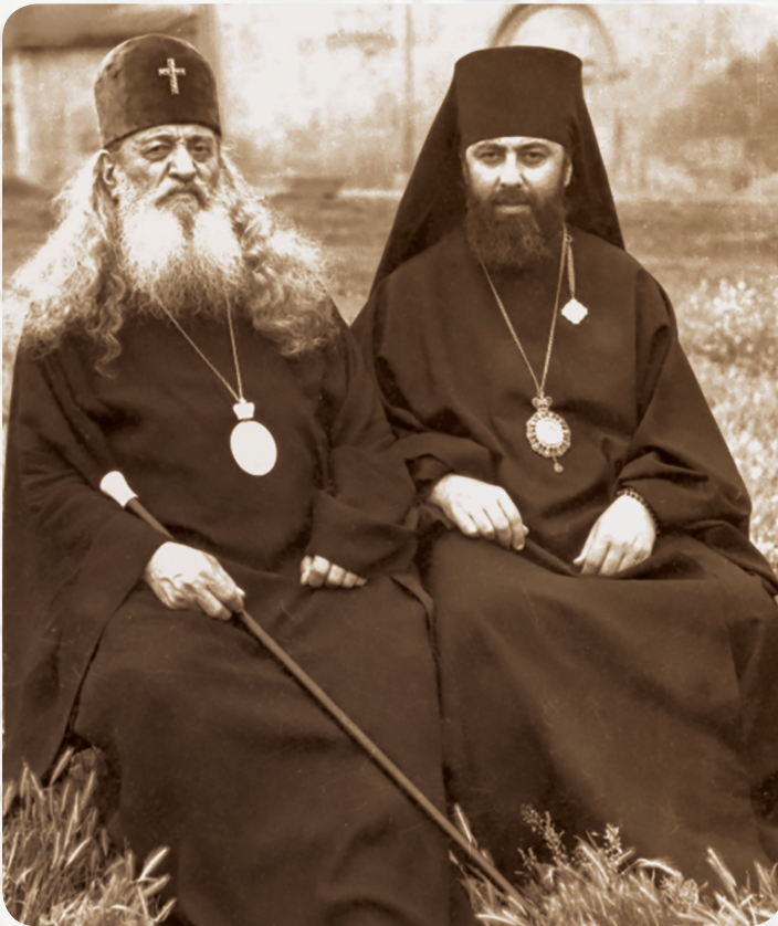
უწმიდესი ეფრემ II და მეუფე ილია

ილიკო, ვინიროზა ბინისათვის, ფეჩისათვის, შემისათვის მიძას დასჭირდეს გროშები