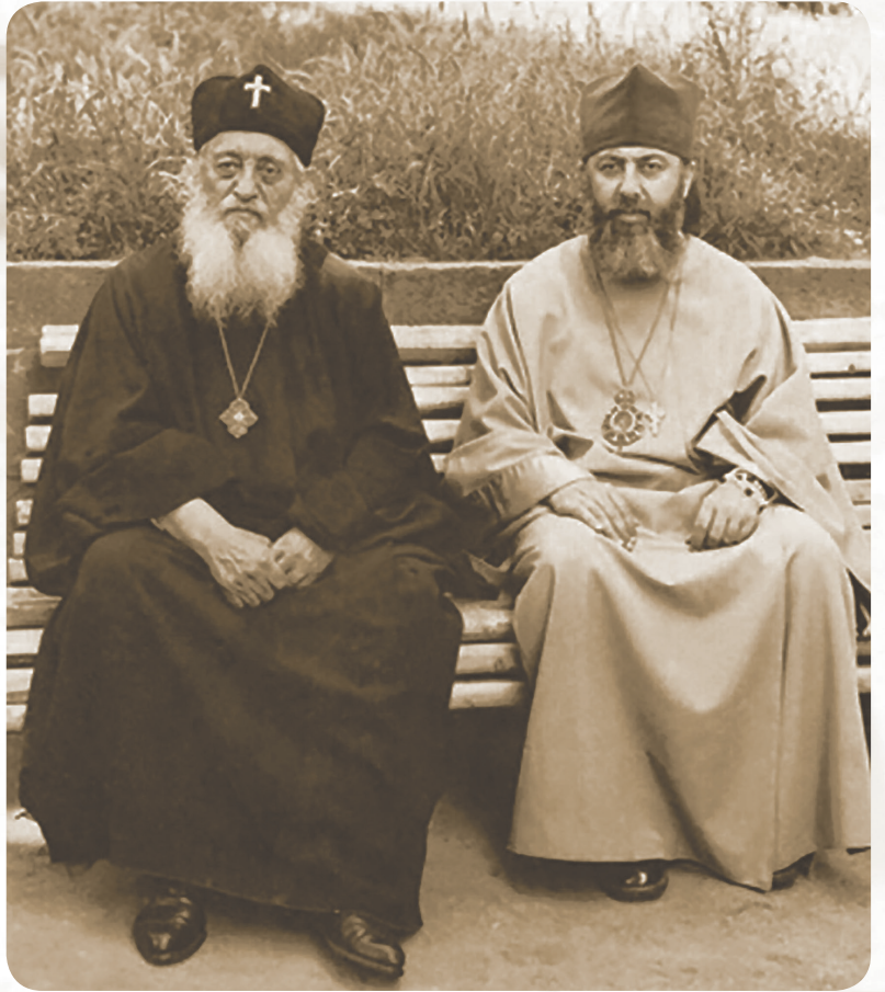
პატრიარქი ეფრემ II და მიტროპოლიტი ილია

ჩემი პირველი რექტორი ბრძანდებოდა ბათუმის ეპისკოპოსი ილია (შიოლაშვილი). სასულიერო სემინარია მცხეთაში, სვეტიცხოვლის ტაძრის ეზოში იყო დაფუძნებული. აქვე მდგარ პატარა სახლში ხუთი სტუდენტი ვცხოვრობდით. ჩვენ ვიყავით სემინარიის პირველი სტუდენტები, მეუფე ილია კი ჩვენი მზრუნველი მამა ბრძანდებოდა. ყოველ საღამოს გვეკითხებოდა, ხომ არაფერი გინდათო.