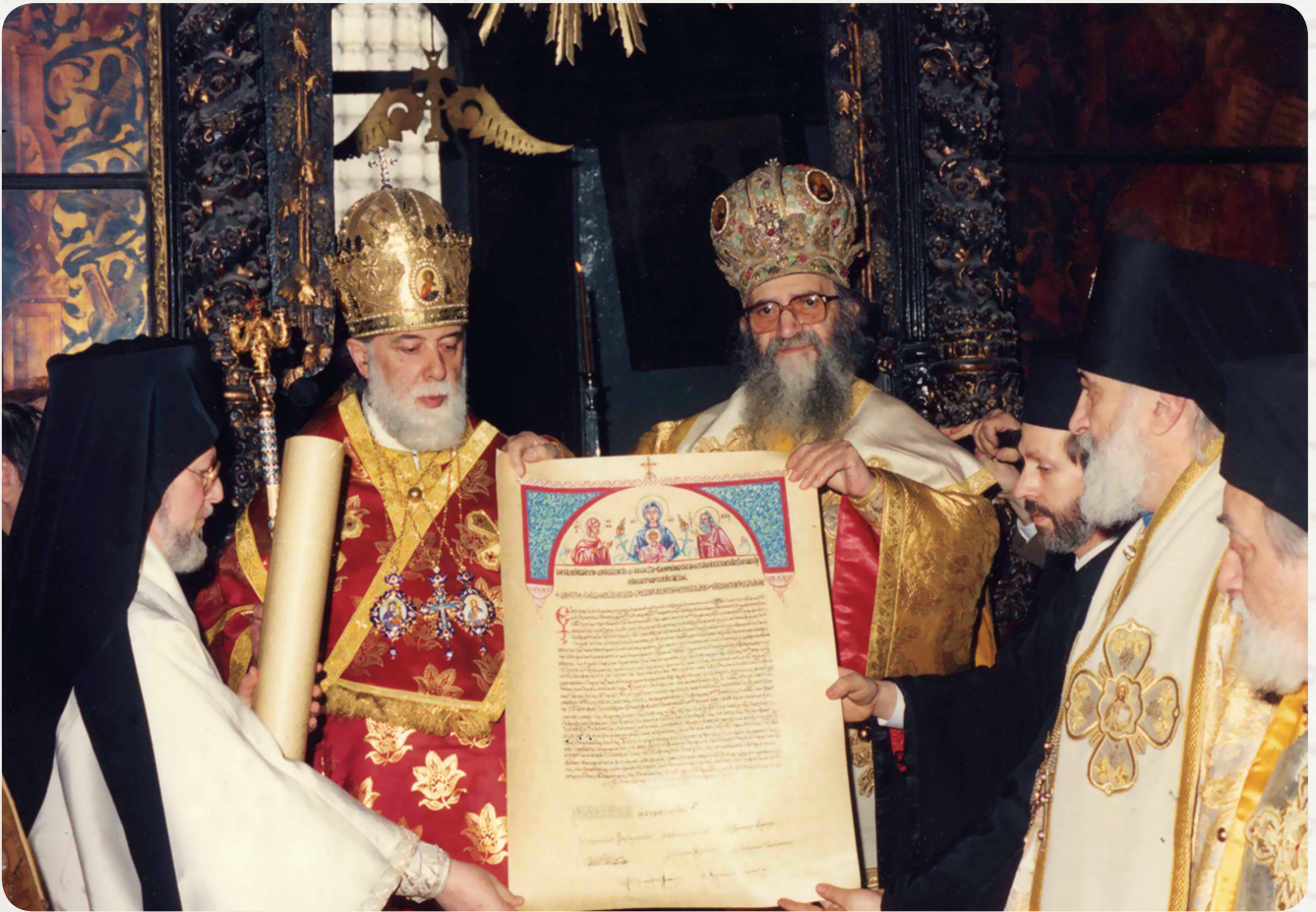
კათოლიკოს-პატრიარქი ილია II და მსოფლიო პატრიარქი დიმიტრიოსი ავტოკეფალიის ცნობისა და მტკიცების სიგელით

ცნობილი იყო, ახლებიც აღმოჩნდა. ბოლოს კი გვითხრა: „ეს ხელნაწერები თქვენ უნდა შეისწავლოთ!“