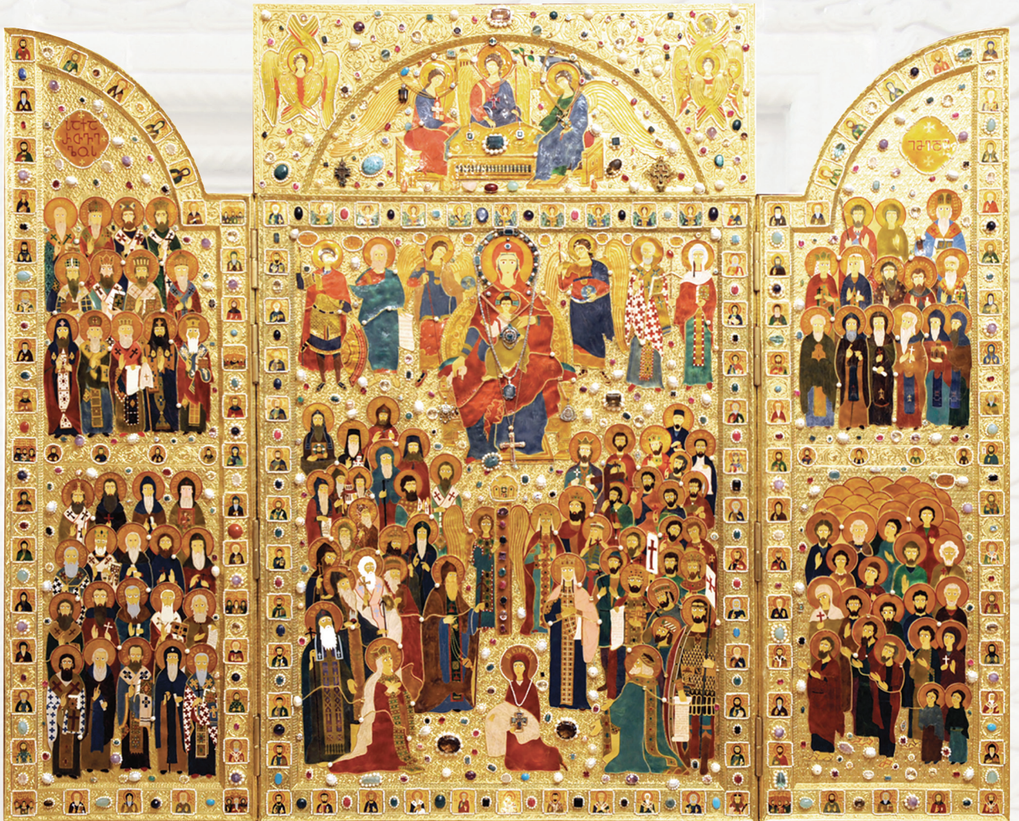
საქართველოს იმედის ხატი

მარჯვენას და ჩვენი გული და სული მისკენ მივმართოთ, რათა ღვთის მაღლით ცოდვის ჭაობს განვეშოროთ და შიგ არ დავინთქათ. ამ სასწაულთა სასწაულს ვზეიმობთ ახლა. ამიტომაც სიხარულითაა მოცული დედამიწა; ჩვენს გამო ხარობს ყოვლადწმიდა სამება და ანგელოზთა დასი, რადგან ხორციელი სიკვდილი აღარ არის მხოლოდ ჯოჯოხეთის კარიბჭე, არამედ იგი მორწმუნეთათვის წარუვალ ნეტარებაში აღმყვანებელ საშუალებად იქცა. ამიერიდან ესა თუ ის პიროვნება ან ეშმაკისა და მისი ანგელოზების ხვედრი შეიქმნება და მარადიული ტანჯვისთვის