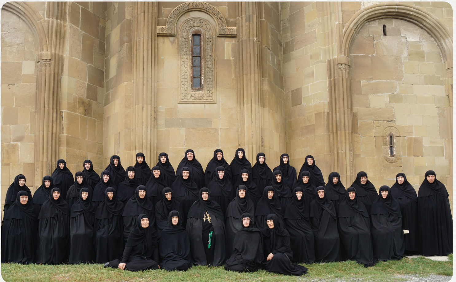
სამთავროს წმიდა ნინოს ღვლათა მონასტრის კრებული