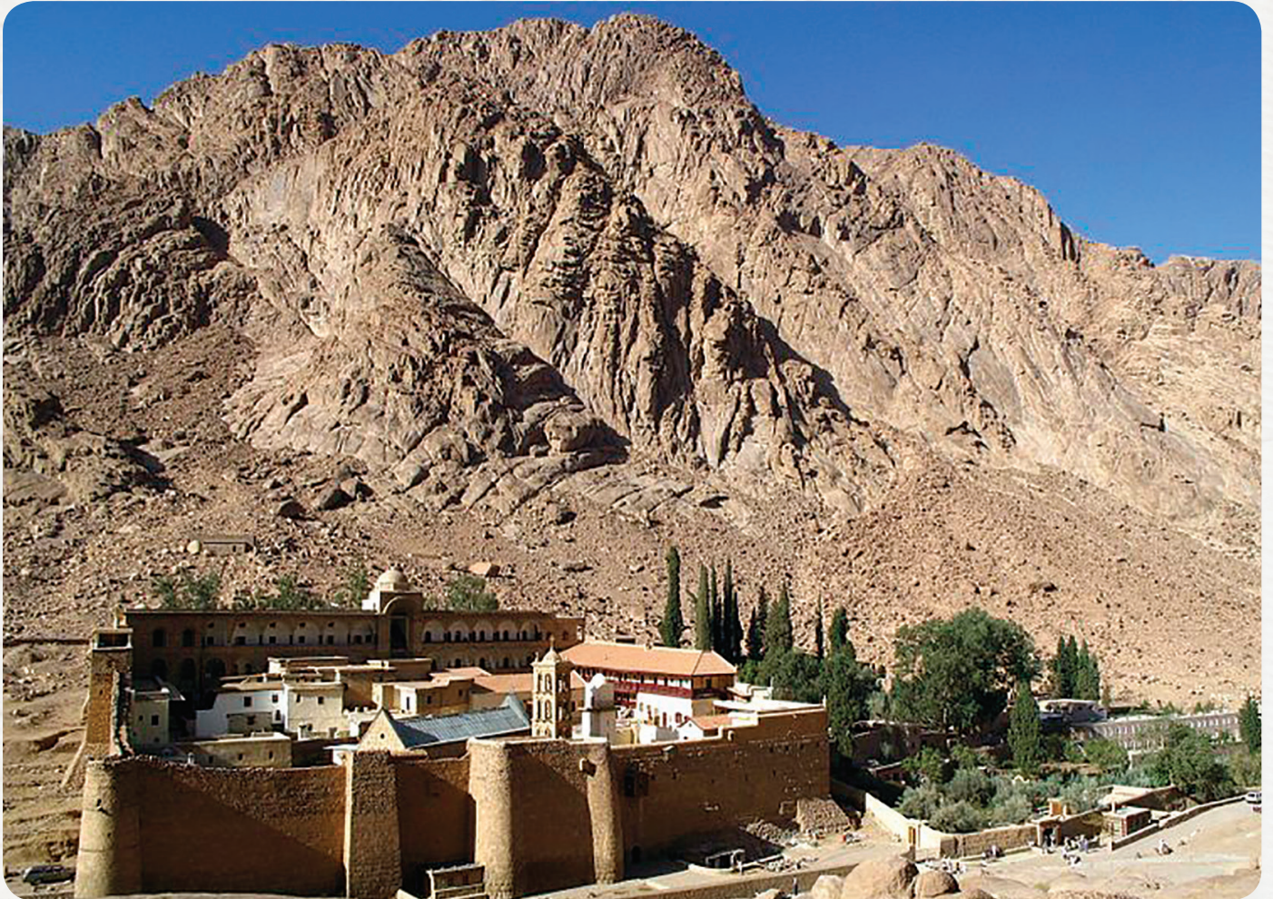
სინას მთა. წმიდა ეკატერინეს მონასტერი

გარნა რა გთხოვო, უფალო, მათთვის, რომელნი უარგყოფენ შენ, რომელნი ვლენან გზასა ცთომილთასა? გეაჯები, შეიწყალენ ივინი, მოაქციე და მრევლსა შენსა შეუერთე, „რათა იყოს ერთ სამწყსო და ერთ მწყემს“.