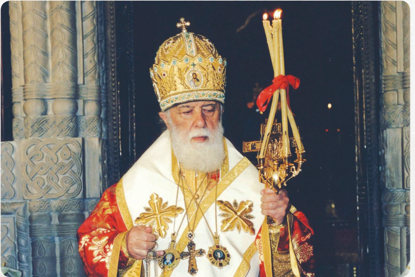
კათოლიკოს-პატრიარქი ილია II სააღდგომო ლიტურგიისას სიონის საკათედრო ტაძარში

ხდება სიონის ტაძარშიო. მიუხედავად იმისა, რომ ჩემი მშობლები ქრისტიანულ დღესასწაულებს – აღდგომას, შობას, მარიამობას, ორივე გიორგობას – იმ დროისთვის დასაშვები ფორმით აღნიშნავდნენ, სააღდგომო