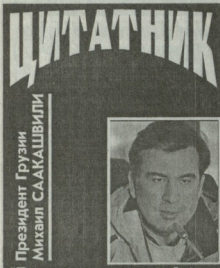
Президент Грузии Михаил САКАШВИЛИ

"Пока некоторые политики обвиняют правительство в том, что оно, якобы, борется с коррупцией, мы строим храмы. Я хочу поблагодарить всех, кто пожертвовал денежные средства для возведения монастыря в Дарьямском ущелье, но основные средства, необходимые для строительства, выделило правительство Грузии".