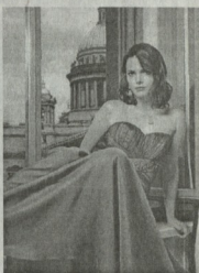
Лиза Боярская и Максим Матвеев.

Максин очень расстраивается по этому поводу, что влетает за собой неизбежные скандалы в семье. Но Лиза девушка самостоятельная и сама решает как ей поступать, сейчас она выбирает путь строительства карьеры, занимается собой и не смотрит на обиды мужа.