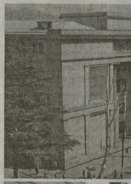
Так выглядит сейчас Бюрово Дасад и двор оваловской ИМЭЛа.

знать как принадлежность нашей истории и образцу искусства. В отношении памятников архитектуры это особенно заметно, поскольку об-