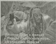
Джони Депп в фильме «Пираты Карибского моря: на странных берегах».

Изначально предполагалось, что сценаристом «Тонкого человека» станет Джерри Стап. Однако эта версия сценария так и не была написана, и в результате работу поручили Келпу.