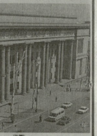
Таковы сегодня облик фасада и двор оваловской ИМЭЛа.

ного музея, очень непросто отвечать на вопросы, каков следует представлять посетителям грузинскую литературу XX века. Над ос-