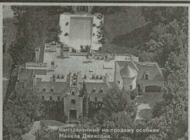
Выставленный на продажу особняк Майкла Джексона.

Все бывшие девушки Джона Деппа (среди них наибольшее количество бывших у актера был с Вайноной Райдер и Кейт Мосс) похололи между собой и внешне, и поведением. Но видимо Джону решил основательно познакомиться с Ванессой из-за ее задорного характера и чувства юмора. И, хотя, хо-