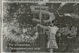
На открытии Панармянских игр

Развитие спортивного движения в Армении и сопредельных странах, а также обмен опытом и информацией в области спорта — таковы основные задачи Панармянских игр. Инициатором этих игр выступили на этих соревнованиях представители из Армении, Грузии, Азербайджана, Казахстана, Украины, России и Беларуси. Впервые турнир состоялся в 1997 году в Ереване. Инициатором выступил Всемирный комитет по развитию спорта, на котором первым президентом был избран представитель Армении.