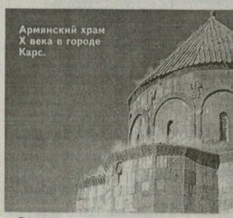
Официально о намерениях властей премьер-министр Турции объявил в воскресенье, 28 августа. Против главной политики правительства о возмещении ущерба выступала парламентская оппозиция. Настинная конфискация собственности у религиозных общин началась в 1936 году, когда немусульманские организации были обязаны предоставить перечень своего имущества. В 1974 году был принят закон, запрещающий этим организациям приобретение новой собственности.

Возвращению подлежат собственность, отобранная у турецких греков, армян и иудеев в 1936 году. В случае, если конфискованная собственность была передана, правительство обязано выплатить за нее денежную компенсацию. В перечень собственности, которая будет возвращена христианским и иудейским организациям, попали бывшие монастыри, здания больниц и школ, кладбища.