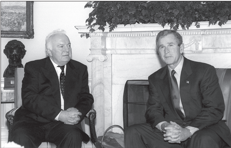
2001 წლის 5 ოქტომბერი. ვაშინგტონი. თეთრი სახლი — საპარტიველოს პრეზიდენტი ედუარდ შივარდნაძე და აშშ-ის პრეზიდენტი ჯორჯ ბუში