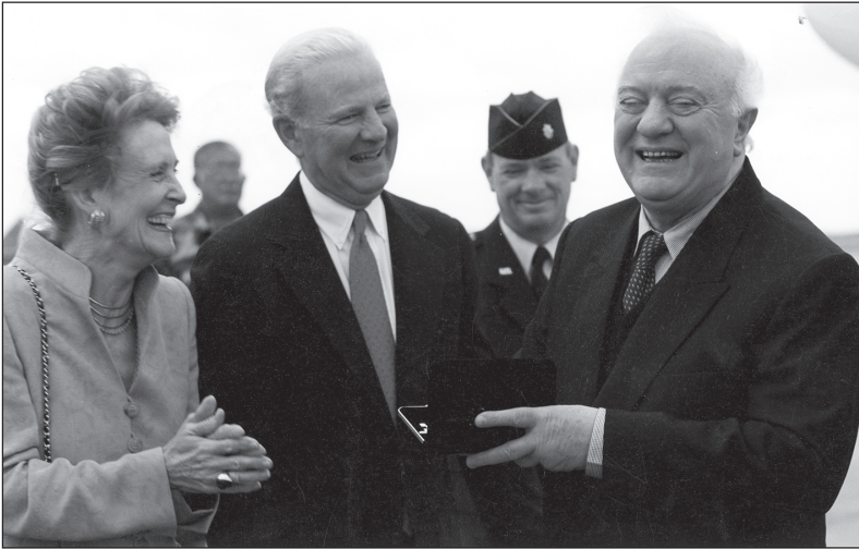
1999 წლის 21 აპრილი. აშშ. ქ. ჰიუსტონი. აშშ-ის ყოფილი სახელმწიფო მდივანი ჯიმ ბაიკერი, მისი მეუღლე სიუზანი და ელზარდ შვეპარდნაძე