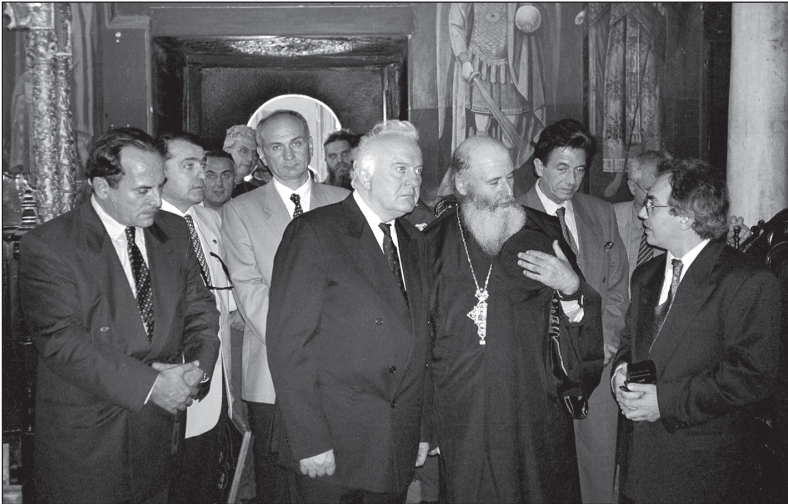
1997 წლის სექტემბერი. ათონის ივერთა მონასტერში