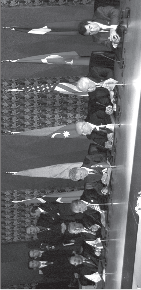
1999 წლის 18 ნოემბერი — ძ. სტამბოლში ეუთოს სამიტის ძარტიისა და ბაქო-თბილისი-ჯეიჰანის ნავთობსადენისა და ტრანსკასპიური მილსადენის მშენებლობის პროექტების ხელმოწერის ცერემონიაზე: ყაზახეთის პრეზიდენტი ნურსულთან ნაზარბაევი, აზერბაიჯანის პრეზიდენტი ჰეიდარ ალიევი, აშშ-ის პრეზიდენტი ბილ კლინტონი, თურქეთის პრეზიდენტი სულეიმან დემირელი, სამართველოს პრეზიდენტი ელზარდ შეიხონოვი, თურქმენეთის პრეზიდენტი საფარმურატ ნიაზოვი