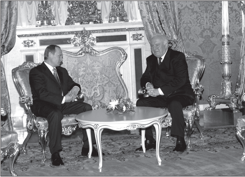
2000 წლის 25 იანვარი. პირისპირ შეხვედრა კრემლში. ვლადიმერ პუტინი და ედუარდ შევარდნაძე