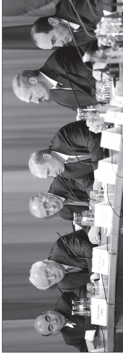
დსთ-ის წევრი ქვეყნების პრეზიდენტები მორიგ სამიტზე: ასახარ აბაევი (ყირგიზეთი), ელზარდ შივარდნაძე (საქართველო), პილარ ალიევი (აზერბაიჯანი), ვლადიმერ პუტინი (რუსეთი), ალექსანდრე ლუკაშენკო (ბელარუსი), რობერტ შოჩარიანი (სომხეთი)