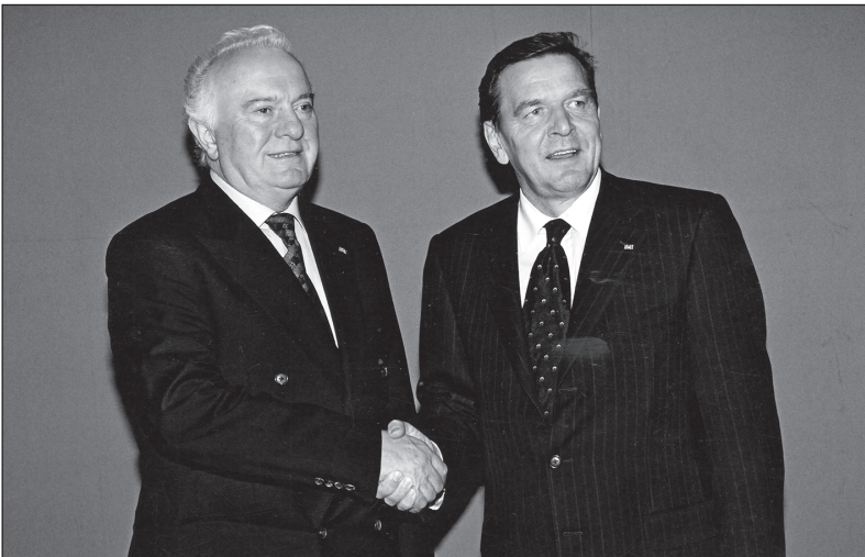
1999 წლის 13 ოქტომბერი. ბერლინი — საქართველოს პრეზიდენტი ედუარდ შევარდნაძე და გერმანიის ფედერაციული რესპუბლიკის კანცლერი გერჰარდ შრიომდერი