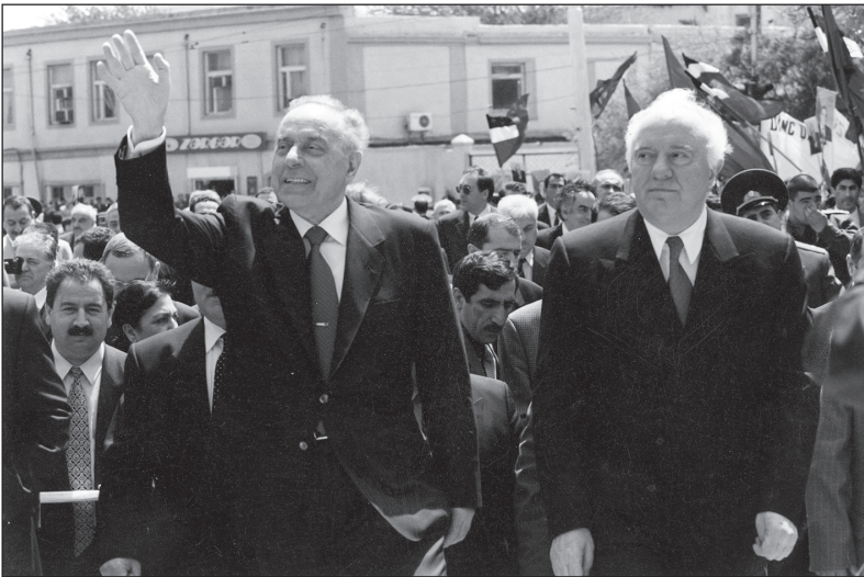
1997 წლის თებერვალი. ქ. ბაქო — ჰეიდარ ალიევი და ედუარდ შევარდნაძე