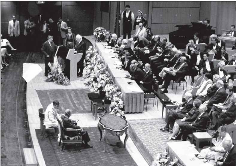
1997 წლის 16 სექტემბერი. ათენი — საქართველოს პრეზიდენტ ედუარდ შევარდნაძის გამოსვლა ონასისის სახელობის საერთაშორისო პრემიის გადაცემის ცერემონიაზე