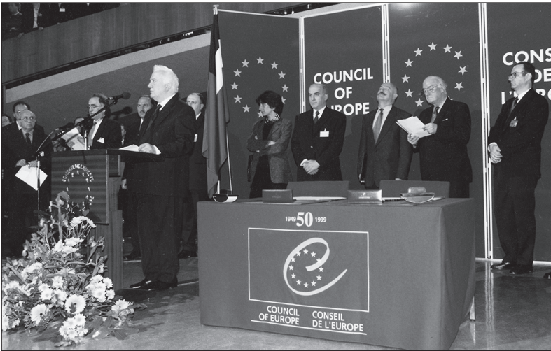
1999 წლის 27 აპრილი. ქ. სტრასბურგი — საქართველოს ევროსაბჭოში განწევრების ცერემონიაზე