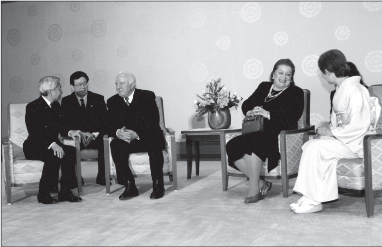
1999 წლის 8 მარტი. იაკონია — საქართველოს პრეზიდენტ ედუარდ შევარდნაძისა და ქალბატონ ნანულის შეხვედრა იაკონიის იმპერატორ აკივიტოსთან და მის გეულესთან