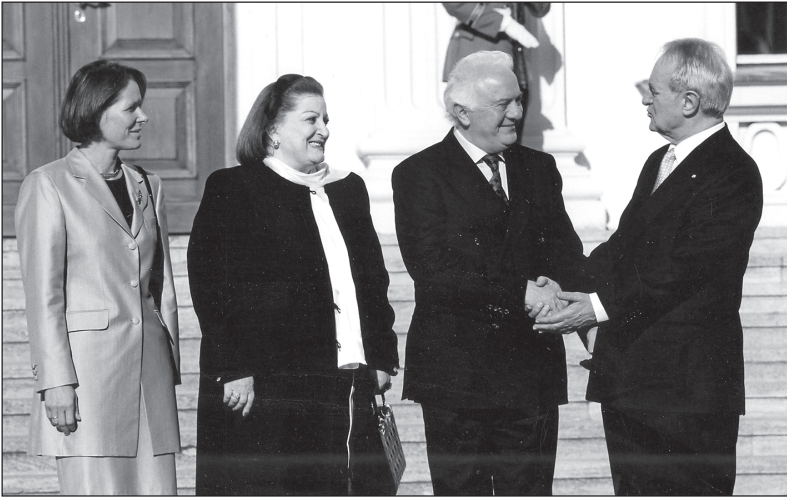
1999 წლის 13 ოქტომბერი. ბერლინი — საქართველოს პრეზიდენტი ედუარდ შევარდნაძე, ქალბატონი ნანული შევარდნაძე და გერმანიის ფედერაციული რესპუბლიკის პრეზიდენტი იოჰანეს რაუ მეუღლითურთ