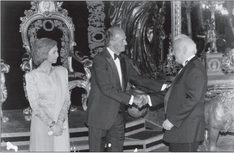
1997 წლის ივლისი. შახვედრა ესპანეთის მეფესთან — ხუან კარლოსთან