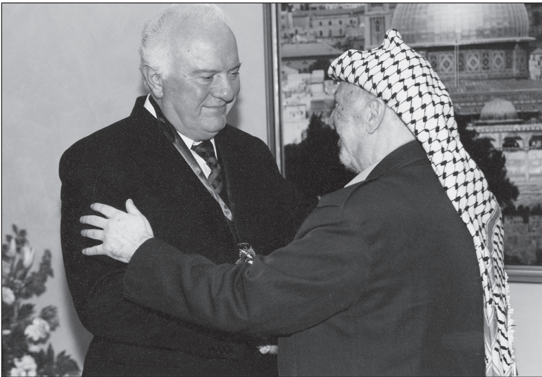
2000 წლის 6 იანვარი — შეხვედრა პალესტინის ეროვნული ადმინისტრაციის მეთაურთან — იასირ არაფატთან