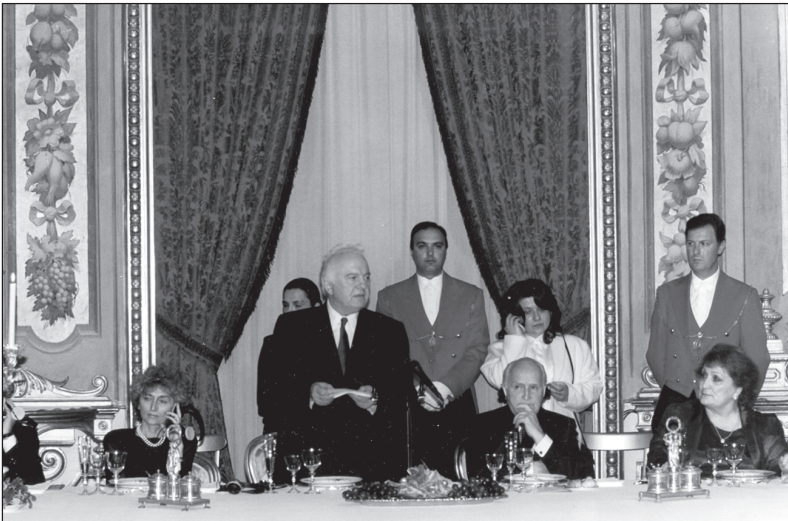
1997 წლის 14 მაისი. რომი — საღილი იტალიის პრეზიდენტ ოსკარო ლუიჯი სკალფაროს სახელით საქართველოს პრეზიდენტ ელზარდ შვეპარდნაძის პატივსაცემად