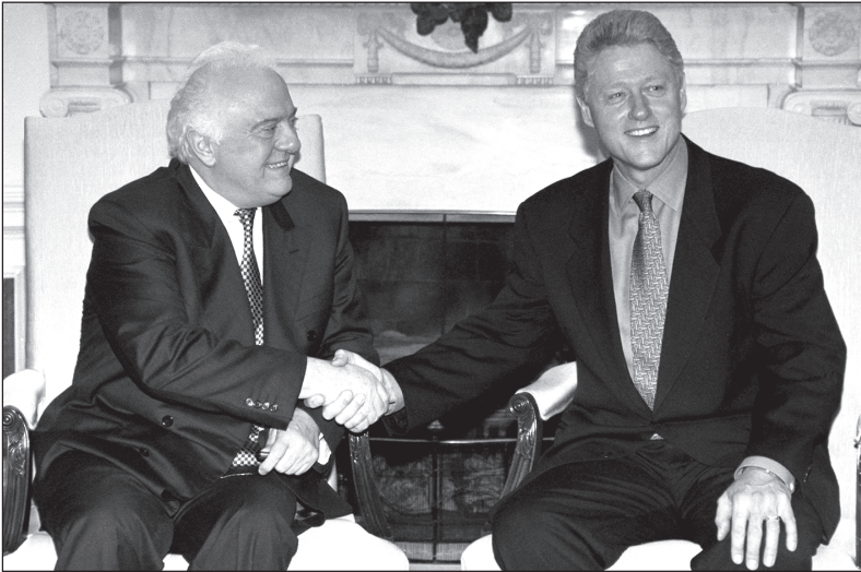
1997 წლის ივლისი. ვაშინგტონი. თეთრი სახლი — საპარტიველოს პრეზიდენტი ედუარდ შივარდნაძე და აშშ-ის პრეზიდენტი ბილ კლინტონი