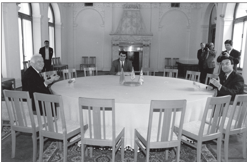
იალტა. ლივადიის სასახლე. „დიდი სამეულის“ ისტორიული შეხვედრის მაგიდასთან