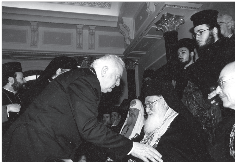
2000 წლის 7 იანვარი. პეტლეში — საღვთსანაწულო მსახურების დროს საშობაო გაზილიკაში