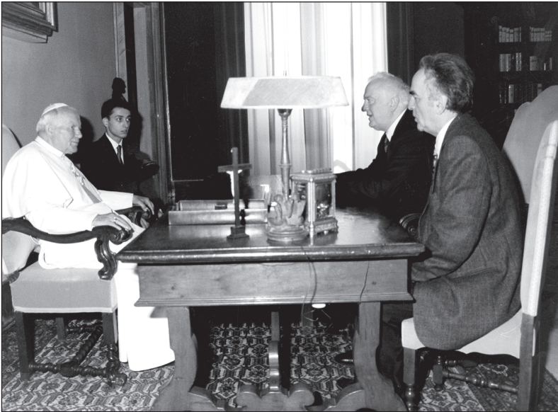
1997 წლის მაისი. ვატიკანი. შეხვედრა რომის პაპთან — იოანე-პავლე II-სთან