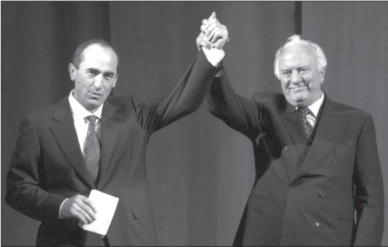
2001 წლის 23 ოქტომბერი. სომხეთში ოფიციალური ვიზიტის დროს. სომხეთის პრეზიდენტ როზარტ ქოჩარინთან ერთად