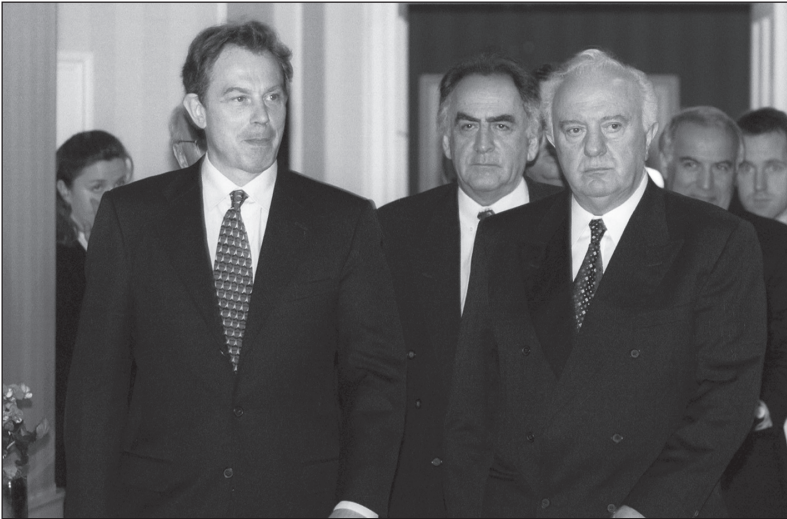
2000 წლის 17 ივლისი, ლონდონი. დიდი ბრიტანეთისა და ჩრდილოეთ ირლანდიის გაერთიანებული სამეფოს პრემიერმინისტრი ტონი ბლერი და საქართველოს პრეზიდენტი ედუარდ შევარდნაძე