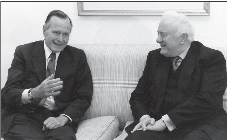
1999 წლის 21 აპრილი, ქ. ვიუსტონი, სანტუმრო „უორვიკ პლაზა“ — საქართველოს პრეზიდენტი ედუარდ შევარდნაძე და აშშ-ის ყოფილი პრეზიდენტი ჯორჯ ბუში