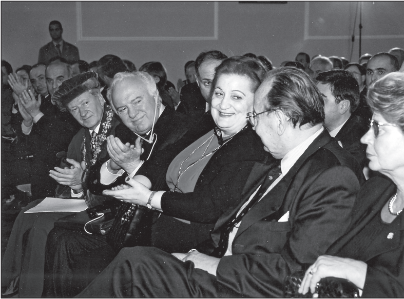
1999 წლის 15 ოქტომბერი. ედუარდ შავარდნაძე, ნანული შავარდნაძე და ჰანს დიტრიხ ბენშეიერი