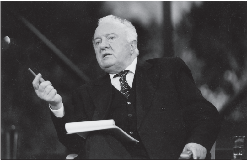
საქართველოს პრეზიდენტი ედუარდ შევარდნაძე

წიგნი გამოიცა ედუარდ შევარდნაძის დაბადებიდან 90 წლის იუბილესთან დაკავშირებით