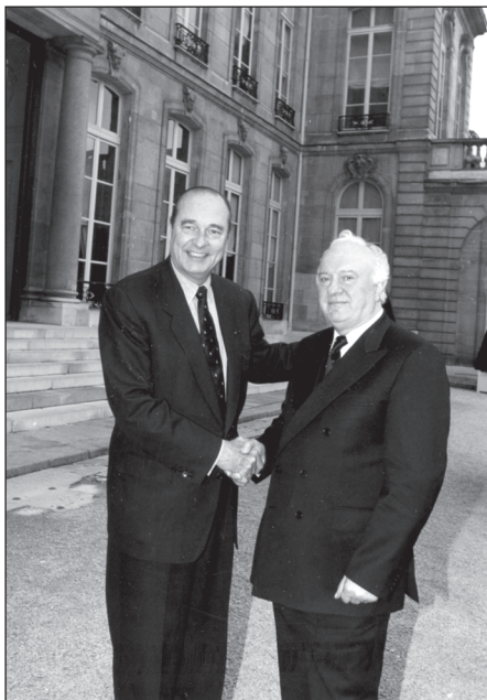
1997 წლის 3 თებერვალი. პარიზი. საფრანგეთის პრეზიდენტი ჟაკ შირაკი და საქართველოს პრეზიდენტი ედუარდ შევერდნაძე