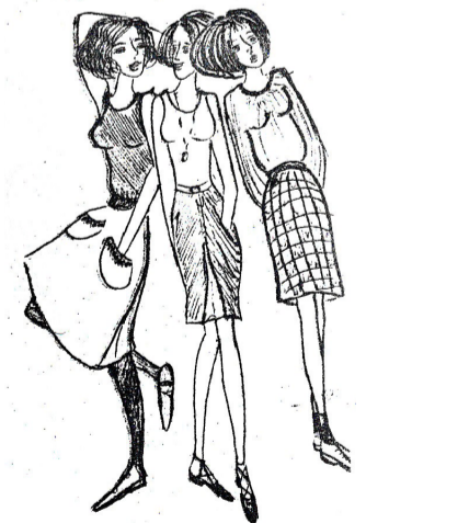
„ვერეს უბნის ზმანებანი“ ნახატი: თამარ გედევანიშვილისა

სულმ მტინარამ ჰოი, პატარა, უსუსურო, სულმ მცინარავ, ამ შუადღეზე რა ძილქუშმა დაგამძინარა, რარიც გიხდება დაფოთლილი იას ჩრდილები, წყნარი დობილი-ნაკადული, ნამის ღილები. დრო მიმდინარებს, შენ კი მარად გძინავს შუადღით, მკრთალ მელოდიის ქარვის ფიფქთა, ლურჯი სურათით.