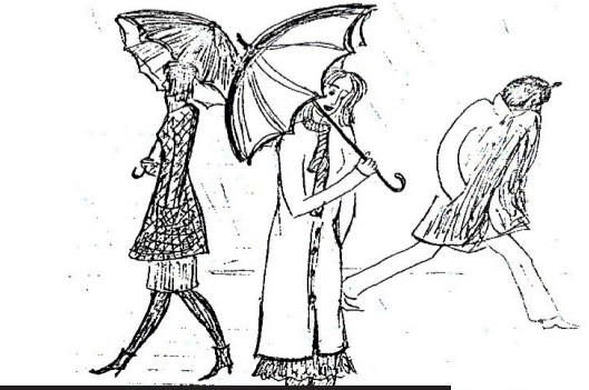
„ვერეს უბნის ზმანებანი“ ნახატი: თამარ გედევანიშვილისა