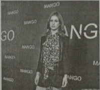
Тали Леннокс — звезда нового зимнего каталога MANGO.

Открыла и закрыла показ английская модель Тали Леннокс, которая стала лицом нового зимнего каталога MANGO. Своим уникальным стилем и чувством юмора Тали дает тренду глоток свежего воздуха, являясь