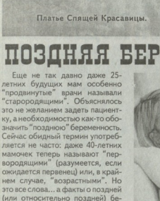
Плате Спящей Красавицы.

Мы нисколько не сомневаемся, что коллекцию ждет огромный успех. Какая невеста не захочет быть похожей на любимую принцессу из мультфильма? Фасоны этих платьев станут очень популярными. Как это стало и в платях Кейт Миддлтон после ее свадьбы с принцем Уильямом.