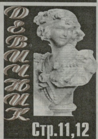
Стр. 11, 12

В центре Тбилиси насмерть сбил сотрудника патрульной полиции. Как сообщают в полиции Тбилиси, автомобиль сбил патрульного у гостиницы "Хелидид инн", после чего пытался скрыться. Однако патрульные организовали погоню и автомобиль с водителем, который сбил патрульного полицейского, выдержали в поликопелете от места происшествия. Сейчас проводится экспертиза автомобиля. По факту ведется следствие.