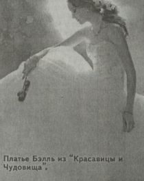
Плате Белль из "Красавицы и Чудовища".

Кто из нас не мечтал стать орденом сказочной принцессой? Особенно при просмотре знаменитых сказок "Disney". Знаменитый дизайнер свадебных нарядов Алфред Анджело решил, что мечты должны сбываться, хотя бы на один день. И создал коллекцию "Disney's Fairy Tales Weddings by Alfred Angelo". Вдохновение для этой коллекции стали самые любимые принцессы из сказок "Disney" - Ариэль, Аврора (Спящая Красавица), Белль, Золушка, Жасмин, Белоснежка и Тиана.