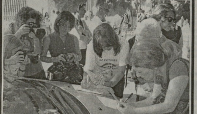
Продолжение темы на 3-й стр.