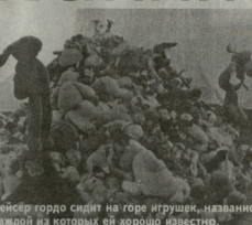
Чейсер гордо спит на горе игрушек, название каждой из которых ей хорошо известно.