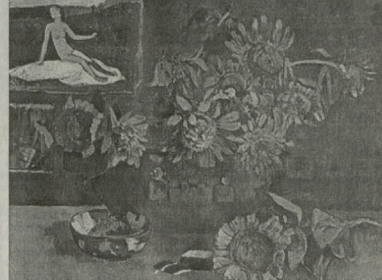
Картина Поля Гогена "Автопортрет а л'Эсперанс", написанную в память о Винсенте Ван Гоге, оценили в 10 миллионов фунтов стерлингов (15,4 миллиона долларов). Это полностью, скорее хранилось в частной коллекции и не выставлялось с 1989 года, Гоген написал в 1901 году на Таити.

На картине изображены подсолнухи — частая тема в творчестве Ван Гога (в особенности известна картина 1888 года "Ваза с 12 подсолнухами"). Первые картины с изображением подсолнухов Ван Гог начал писать в Арле, где он с Гогенем жил в одном доме летом 1888 года. Одна из картин украсила стену спальни Гогена. Аукцион "Christie's", на котором должен быть продан натюрморт, состоится 9 февраля в Лондоне. Как рассказала представитель аукционного дома, 10 миллионов фунтов — верхняя граница оценки, но картина может быть продана и дороже. По ее словам, творчество Ван Гога было не единственным источником вдохновения для Гогена: на картину также можно найти следы влияния Элгара Дега. Всего на аукцион "Christie's" будут выставлены 78 лотов, общая оценочная стоимость которых составляет 108,7 миллиона фунтов стерлингов (169 миллионов долларов). Наиболее интересными лотами, помимо Гогена, объявлены натюрморт Жоржа Брака и пейзаж Андре Дерена.