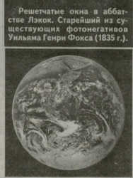
Первый снимок полностью освещенной Землей, сделанный экипажем "Аполлона 17" (1972 г.).

Решетчатые окна в абрастове Ленок. Старейший из существующих фотомегалитов Уильяма Генри Фокса (1835 г.).