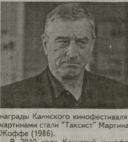
Жюри следующего кинофестиваля в Каннах возглавит Роберт де Ниро.

Следующий (уже 64-й по счету) Каннский кинофестиваль будет проходить с 11 по 22 мая. Де Ниро заявил, что рад возможности принять участие в мероприятии, так как фестиваль является "одним из старейших и лучших в мире". Ранее два фильма с участием де Ниро удостоивались главной награды Каннского кинофестиваля — "Золотой пальмовой ветви". Этими картинами стали "Таксист" Мартина Скорсезе (1976) и "Миссия" Роланда Жоффе (1986). В 2010 году Каннский кинофестиваль проходил с 12 по 23 мая. Председателем жюри был Тим Бертоу. "Золотую пальмовую ветвь" получил режиссер из Таиланда Аликитпон Вираветсанут на фильм "Дядюшка Бунни, который мог вспомнить свои прошлые жизни".