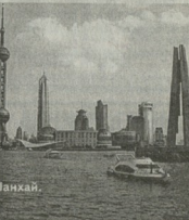
Вид на Шанхай.

В Пекине планируют построить высотный многофункциональный комплекс, который по архитектуре будет напоминать самое высокое здание в мире — "Бурдж Халифа" в Объединенных Арабских Эмиратах. Комплекс, основное место в котором займет семизвездочная отель, будет расположен в пекинском районе Мянэ-тоушэу в 20 километрах западу от центра города. Высота здания и его параметры пока не раскрываются. Известно, что оно будет иметь сужающуюся кверху форму, такую же как у "Бурдж Халифа" (высота — 828 метров). Реализация проекта обойдется в 1,3 миллиарда долларов. Предполагается, что финансировать строительство будут инвесторы из Саудовской Аравии. Строительные работы будут выполнять китайские компании.