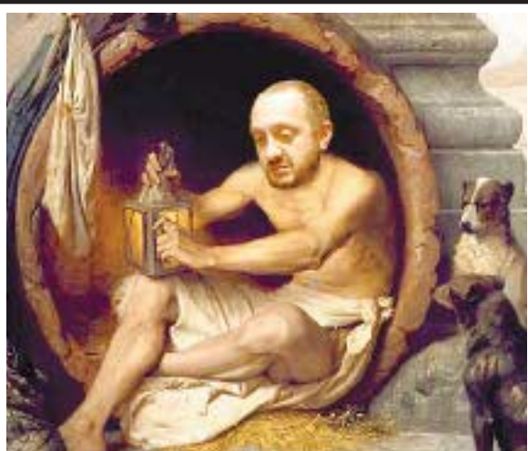
ფილოსოფოსი კასრუი ვიუსი მე და არა რეზიდენსიაში, პრეზიდენტად

ეს „ჩანერგილები“ შინაგან საქმეთა მინისტრს ემუქრებიან, საზოგადოებას მიანიშნებენ, ჩვენ უფლება გვაქვს გაგინოთ, გიგინოთ ოჯახი, კიდეც დავლევთ, შეურაცხყოფას მოგაყენებთ, პატრიარქსაც შეგიგინებთ, თქვენ კი ხმის ამოღება არ გაბედოთო. არ არის ეს ქვეყნის აბუჩად აგდება?