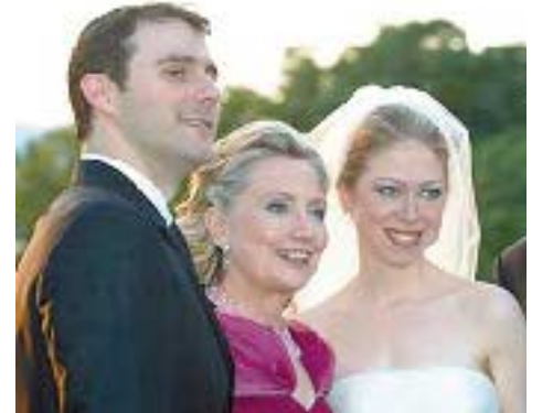
პატარძალს დიზაინერ ვერა ვონგის კაბა ეცვა. დახვეწილი მენიუს შესაქმნელად სამი უმსხვილესი კომპანია ზრუნავდა, რომელთა მომსახურება დაახლოებით 750 000 დოლარი დაჯდა. ერთგულების ფიცი ახალგაზრდებმა ერთდროულად პასტორისა და რაბინის წინაშე წარმოთქვეს, რადგან ჩელსი მეთოდისტია, მარკი კი — იუდეველი.

კიმ კარდაშიანი და კრის ჰემფრისი ღირებულება: 10 მლნ. დოლარი. წელი: 2011. კიმ კარდაშიანის სახელი სიმდიდრესთან ასოცირდება. მიიღო რა კალათბურთელ კრის ჰემფრისის წინადადება ქორწინების