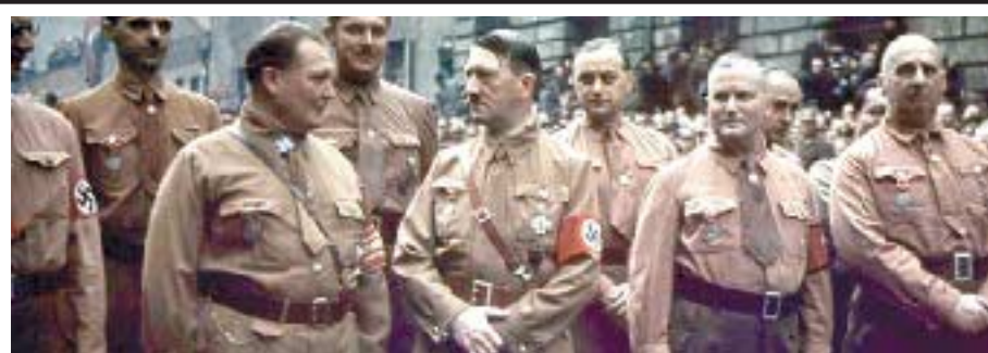
მარტინ ბორმანი - ჰიტლერის პირადი მდივანი, სტალინის საიღუმელო აგანტი იყო?!