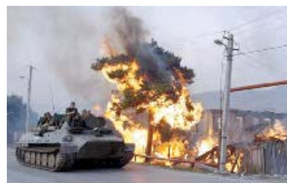
თუ ეს პროვოკაცია იყო, რატომ ემზადებოდნენ „ნაციონალები“ აგვისტოს ომისთვის სამი თვით ადრე?