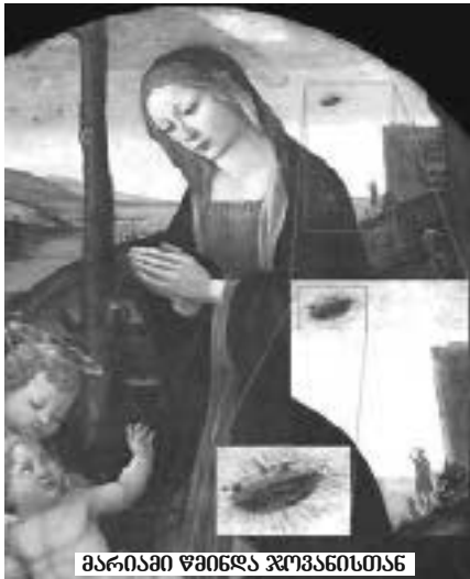
მარიამი წმინდა ჯოვანისთან

მონასტერი 1327 წელს წაბლის ტყეში დააარსა სერბეთის მეფე სტეფან ურო III-მ (ჩანაწერი ამის შესახებ 1330 წლით დარიღდება). მმომდევრო წელს მეფე გარდაიცვალა და მშენებლობა მისმა ვაჟმა ურომ IV-მ განაგრძო. სამუშაოები 1335 წელს დათავრდა, მაგრამ ფრესკების წერა 1350 წლამდე გრძელდებოდა. 2004 წლიდან ვისოკი-ღვინის მონასტერი შესულია იუნესკოს მსოფლიო მემკვიდრეობის ძეგლთა სიაში, 2006 წელს კი ეთნიკური აღბანელების მხრიდან პოტენციური თავდასხმების გამო, მონასტერმა