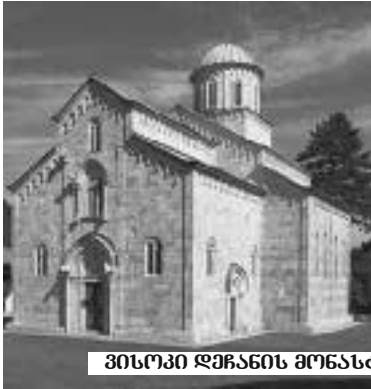
ვისოკი ღვინის მონასტერი და ღვინის ღრეხა