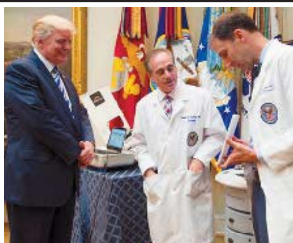
მელორ სტურუა: შეკითხვა: „ჭაუ დუ იუ დუ, მისტერ ტრამპ?“ - კვლავაც უპასუხოდ დარჩა