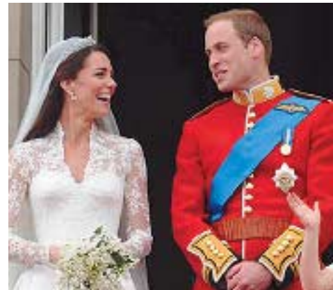
სტერლინგი გამოიყო. სოლიდური ფინანსები გაიღეს ქეით მიდლტონის მშობლებმა.

რელსი კლინტონი და მარკ მეზვინსკი ღირებულება: 5 მლნ. დოლარი. წელი: 2010. აშშ-ის ყოფილი პრეზიდენტის ერთადერთი ქალიშვილის ქორწილი სრულიად საიდუმლო ვითარებაში გაიმართა. წვევილი ნიუ-იორკის შტატის ქალაქ რაინბეკში დაქორწინდა. ქალაქისკენ მიმავალი გზები და საჰაერო სივრცე დახურული იყო, რათა პაპარაცებს ქორწილზე ვერ შეეღწიათ, სტუმრებს კი სპეციალური საიდენტიფიკაციო სამაჯურები მისცეს.