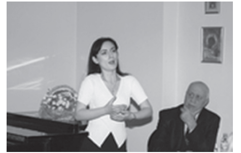
[გაგრძელება მე-4 გვ.]