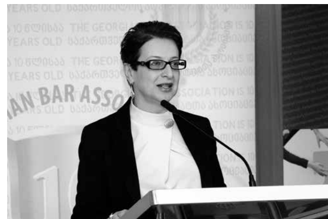
საქართველოს უზენაესი სასამართლო საქართველოს ადვოკატთა ასოციაციას ულოცავს 10 წლის იუბილეს.

2005 წლის 26 თებერვლის საერთო კრებაზე საფუძველი ჩაეყარა ადვოკატთა ასოციაციის, როგორც წევრობაზე დაფუძნებული პროფესიული გაერთიანების ჩამოყალიბებას, რომელიც აგრძელებს და ავითარებს ქართველ ადვოკატთა სკოლის საუკეთესო ისტორიულ ტრადიციებს.