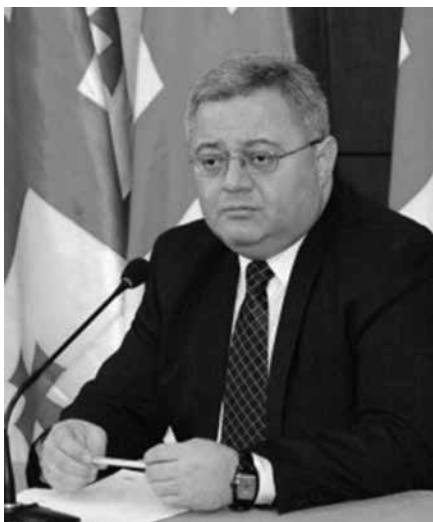
საქართველოს ადვოკატთა ასოციაციას, ძვირფასო კოლეგებო,

ადვოკატთა ასოციაციის იუბილესთან დაკავშირებით, პირველ რიგში, გამახსენდა არა ამ ორგანიზაციის დაფუძნების პერიპეტები, რაც თავისთავად საგულისხმო ეტაპი იყო იურიდიული პროფესიის განვითარების საქმეში, არამედ უფრო ადრეული წლები; წლები, როდესაც ხდებოდა ჭეშმარიტად რევოლუციური გარდატეხები იურისტების ცნობიერებაში, ერთი მხრივ, და იურისტების შესახებ საზოგადოების ცნობიერებაში, მეორე მხრივ.