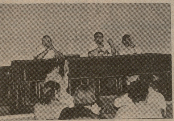
კითხვა საკუთარ თავს

ეს ფოტოები 4 დღის წინათ არის გადაღებული და ის უკვე ჩვენი საზოგადოების, ჩვენი ურნალისტური ცხოვრების ისტორიაა. ამ დღეს ბევრმა დაუსვა საკუთარ თავს კითხვა — ჩვენი ურნალისტური კორპუსიც ისევე დაავადებული პარტიკულარული ტენდენციებით, ვათიშულობის სინდრომით, თუ აქვს მას კონსოლიდირების ის უნარი, რომელიც დაიცავს მას, დაიცავს საჯაროობას, დემოკრატია, მართალ, თავისუფალ სიტყვას?