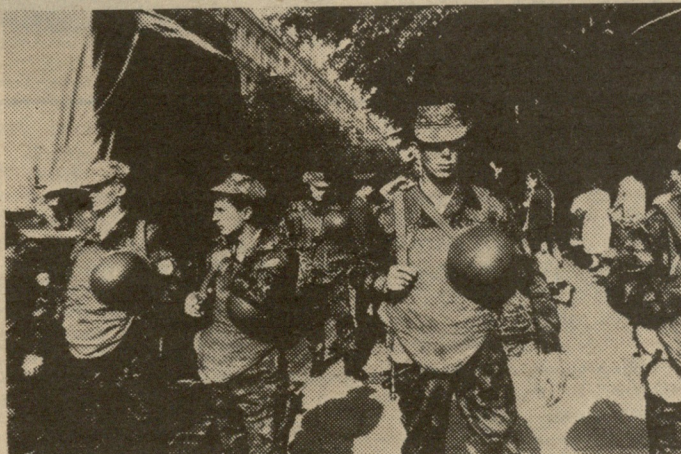
9 მაისი, ჯარისკაცები ვილინიჭის ქუჩებში.

ვილინიჭში შედგა ვალუტის აუქციონი, დოლარი 16-17 მანეთი ღირდა, ოღონდ მსურველს ერთად უთუოდ 1000 დოლარი მაინც უნდა ეყიდა. დოლარები თვალის დახამხამებაში გაქრა; ვილინიჭშივე გაიხსნა სასაიდლო უქონელთათვის, სადაც ქალაქის ლატაკი მოსახლე-