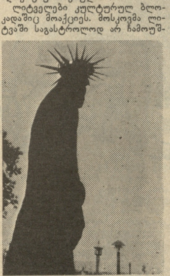
ლიტვის სიმბოლო — ღვთიური წამებული.

ლიტველი ითმენს, ბლოკადა კი — მისი ინიციატივით სვლს-წრაფი და მოუთმენელი — გრძელდება.