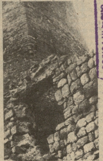
ოლაგ ველებიანის ფოტოები

ქვეყნის სსრ უზენაესი საბჭოს პრეზიდიუმის ბრძანებით