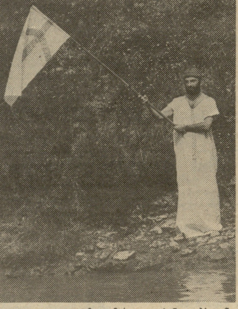
ხანთლებს უნთებენ მერაბ კოსტავას ხსოვნას; ფოტოსურათი ექსპოზიციიდან „ერის ნათლობა“.