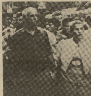
ბის ფოტოგალერეა გახსნა. პირველი გამოფენა წელს, 9 აპრილს დაათვალიერეს მნახვე-