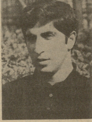
ლით შემოსილ საქართველოს სხვაგვარად არ შეიძლება მოხდეს. მეგობრებო

წას, მის მეუღლეს ან მის შვიდი წლის კოტიკოს, რომელიც თავისი ასაკისათვის უცნაურად, კაცურად გლოვობს მამას... საკუთარი ხელით მიაქვს მავარი ჩი და ბებიას ეხვეწება ცოტა მაინც დალიოსო. ერთი წელი განუწყვეტელ გლოვაშია საქართველო. დავიკვირება ტრელო, აღარ იცის, რომელი ერთი შვილი დაიტროს, ტორტენანეს, ბორგავს, მაგრამ მაინც ანთებს სანთელს ხატის წინ და ჯიუტად იმეორებს: „მეგობრებო ბატონო, გაგვმარჯვებოთ მტერზედა, თუ ამას გავიგონებდი, არ ვიტარებდი მკვდრებზედა. იმავ დღეს, შვილო, დედილო, კრელს ჩავიცოდი კახასა.“ გვკვარა, რომ ვიხილავთ ქრე-