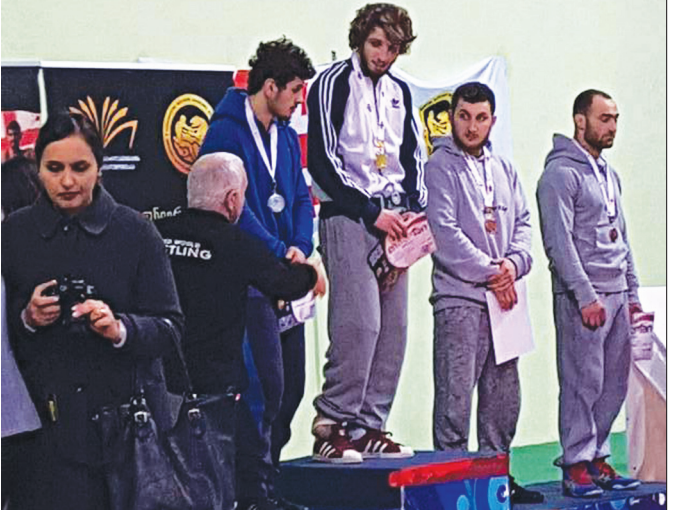
ოზურგეთელი მოჭიდავების ტრიუმფი საქართველოს პირველობაზე